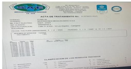
Figura 2. Acta de residuos peligrosos marzo 2025

Los RESPEL son entregados a la empresa SOLUCIONES AMBIENTALES ESPECIALES S.A.S, la recolección se realiza de manera diaria para sus respectivos procesos de transporte, desactivación, incineración y posterior disposición final en celdas de seguridad, Se informó por parte de la representante legal que el tipo de vehículo que recolecta estos residuos es tipo furgón refrigerado y cuenta con características especiales como identificación, sistema de aseguramiento de la carga, condiciones técnicas entre otros, como lo contempla el artículo 5° del Decreto 1609 de 2002. La entidad cuenta con actas de certificado de residuos peligrosos por parte del gestor de disposición final, dando cumplimiento a lo establecido en el decreto 4741 de 2005 compilado en el artículo 2.2.6.1.3.7 del Decreto Único Reglamentario del sector ambiente y desarrollo sostenible 1076 de 2015