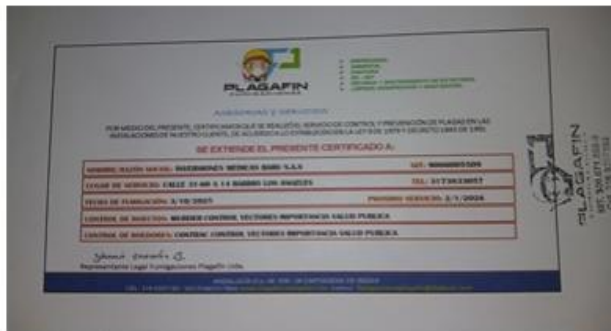
figura 5. Certificado plagafin FUMIGACIONES S.A.S.

INVERSIONES MEDICAS BARU, Realiza fumigaciones con la empresa PLAGAFIN FUMIGACIONES. La última fumigación la realizaron el día 03 de octubre 2025, con periodicidad trimestral.