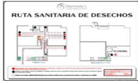
ilustración 2. Ruta interna de residuos

propio. El área tiene paredes y piso de fácil limpieza. Los residuos son transportados desde los consultorios al depósito temporal en las tardes casi al cierre laboral por bajo aforo.