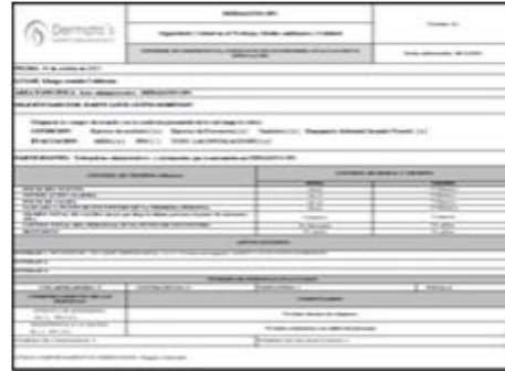
Ilustración 9. Acta simulacro 24 de octubre