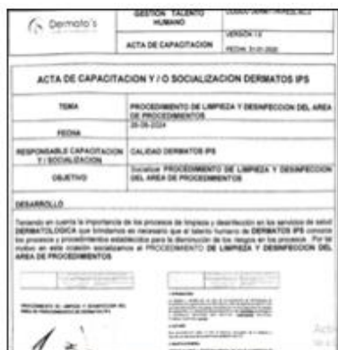
ilustración 5. Acta capacitación

DERMATO'S DERMATOLOGÍA CLÍNICA QUIRÚRGICA Y ESTÉTICA S.A.S presentó evidencia de acta de capacitaciones/socializaciones en temas ambientales como "Procedimiento de limpieza y desinfección en el área de procedimientos, Limpieza y desinfección del depósito temporal de desechos, Manejo de RAEE, Uso de EPP, Manejo de cortopunzantes y Lavado de manos". Conforman grupo administrativo de gestión ambiental y sanitaria – GAGAS.