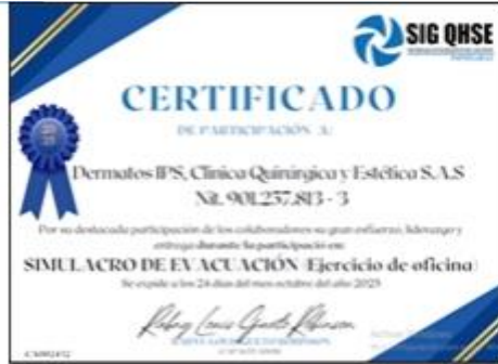
Ilustración 8. Certificado Simulacro