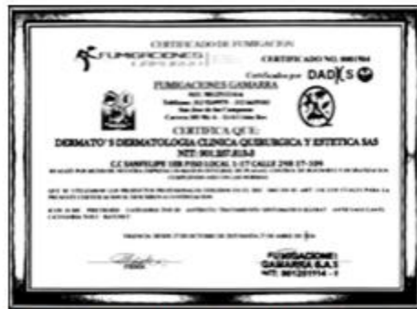
Ilustración 10. Certificado de fumigación

DERMATO'S DERMATOLOGÍA CLÍNICA QUIRÚRGICA Y ESTÉTICA S.A.S realiza el control de plaga con la empresa Fumigaciones Gamarra semestralmente. La última fumigación que se realizó fue el 27 de octubre de 2025 como se evidencia en la imagen 7.