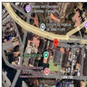
Ilustración 1. Satelital DERMATO'S S.A.S, Google Maps

DERMATO'S DERMATOLOGÍA CLÍNICA QUIRÚRGICA Y ESTÉTICA S.A.S estaba localizada en el barrio Manga sobre la avenida California #26 – 117, la cual se trasladó al barrio Pie del Cerro con calle 29b #17 – 109 dentro del centro comercial Portal San Felipe en la ciudad de Cartagena de Indias D.T. y C. con coordenadas geográficas 10°25'13" N – 75°32'21" O.