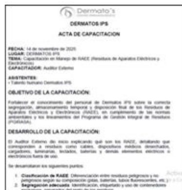
ilustración 7. Acta manejo de RAEE