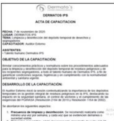
ilustración 6. Acta limpieza depósito.