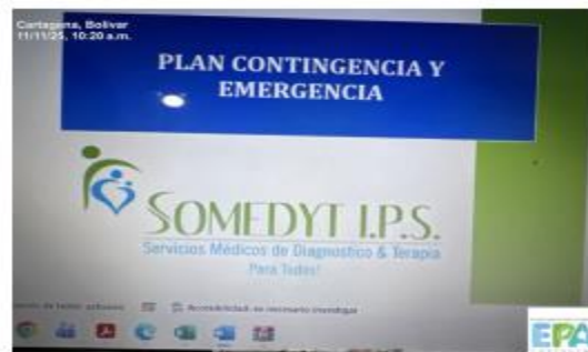
foto 11. Plan de contingencia

SERVICIOS MEDICOS DE DIAGNOSTICOS Y TERAPIAS IPS S.A.S. SEDE POZON cuenta con el Plan de contingencia de acuerdo con lo establecido en el artículo 2.2.6.1.3.1. literal h del decreto 1076 de 2015.