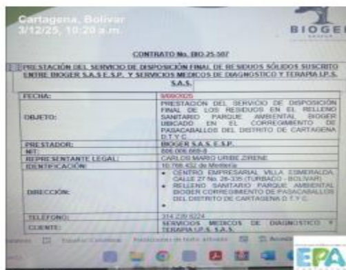
foto 4. Contrato con Bioger

SERVICIOS MEDICOS DE DIAGNOSTICOS Y TERAPIAS IPS S.A.S. SEDE POZON genera residuos peligrosos de tipo riesgo biológico como: Biosanitarios, cortopunzantes, los cuales se disponen con la empresa Bioger S.A. E.S.P.