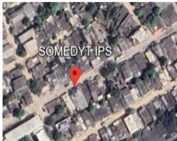
Foto 1 y 2, ubicación y localización

SERVICIOS MEDICOS DE DIAGNOSTICOS Y TERAPIAS IPS S.A.S. SEDE POZON está localizada en el Barrio El Pozón – sector 1ro de mayo – Mz 145 lote 21, con coordenadas 10°24'27"N 75°27'09"W