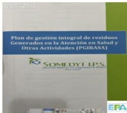
foto 9. Pgirasa

Durante la visita se verificó que cuenta con un Plan de Gestión Integral de Residuos Hospitalarios, el cual se encuentra actualizado al mes de julio de 2024, cumple con las actividades que realiza y con los protocolos de Bioseguridad, diagnóstico de generación de residuos, separación y/o clasificación, conformación del grupo de gestión ambiental y sanitaria, movimiento interno de residuos, recolección interna y externa realizada por el gestor, programa de capacitación, diligenciamiento del formato RH1 y cálculo de indicadores de gestión de residuos hospitalarios y similares.