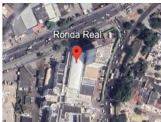
Foto 1 v 2 ubicación y localización

SERVICIOS MEDICOS DE DIAGNOSTICOS Y TERAPIAS IPS S.A.S. SEDE RONDA REAL está localizada en el Barrio Santa Lucia. Centro Comercial Ronda Real, Edif – piso 3. SEDE RONDA REAL con coordenadas 10°23'37"N 75°28'53"W