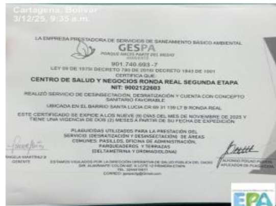
foto 15. Certificado de fumigación

SERVICIOS MEDICOS DE DIAGNOSTICOS Y TERAPIAS IPS S.A.S. SEDE RONDA REAL Realiza fumigaciones de forma bimensual con la empresa GESPA La última fumigación la realizaron el 09 de noviembre de 2025.