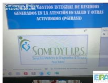
foto 12. Pgirasa

Durante la visita se verificó que cuenta con un Plan de Gestión Integral de Residuos Hospitalarios, cumple con las actividades que realiza y con los protocolos de Bioseguridad, diagnóstico de generación de residuos, separación y/o clasificación, conformación del grupo de gestión ambiental y sanitaria, movimiento interno de residuos, recolección interna y externa realizada por el gestor, programa de capacitación, diligenciamiento del formato RH1 y cálculo de indicadores de gestión de residuos hospitalarios y similares.