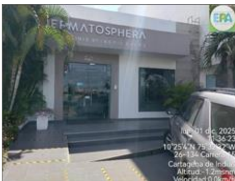
Foto 1. Localización DERMATOSPHERA S.A.S.

DERMATOSPHERA S.A.S. , está localizada en el barrio Manga sobre la avenida Rafael Calvo con carrera 15 #26 – 102 en la ciudad de Cartagena de Indias D.T. y C. con coordenadas geográficas 10°25'4" N – 75°32'32" O