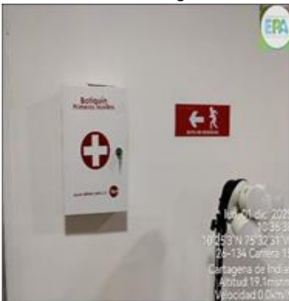
Foto 9. Ruta interna de residuos