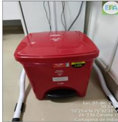
Foto 5. Caneca RESPEL