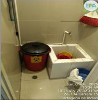
Foto 4. Caneca RESPEL en el depósito

encuentra en un área definida, aunque está dentro del inmueble no está al alcance de los usuarios. El área tiene paredes y piso de fácil limpieza con buena iluminación y con punto para el lavado de la caneca de residuos peligrosos. No realizan pesaje de los residuos ni llevan un registro en formato RH1. La puerta no tiene señalización de riesgo biológico y personal autorizado. La caneca esta etiquetada y en buen estado.