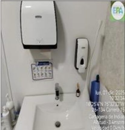
Foto 8. Lavamanos