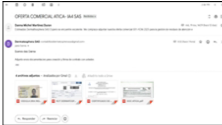
Ilustración 2. Proceso de contrato con Ática S.A