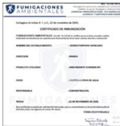
Ilustración 3. Certificado de fumigación

DERMATOSPHERA S.A.S. realiza el control de plaga con la empresa Fumigaciones Ambientales cada cuatro meses. La última fumigación que se realizó fue el 22 de noviembre de 2025 como se evidencia en la ilustración 3.