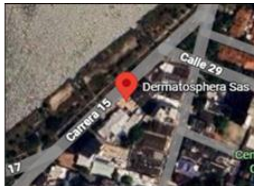
Ilustración 1. Satelital DERMATOSPHERA S.A.S, Google Maps