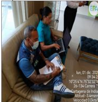
Foto 2. Socialización gestión externa RESPEL