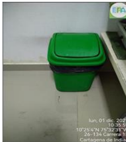
Foto 3. Caneca desechos ordinarios

* MANEJO DE RESIDUOS SÓLIDOS ORDINARIOS Durante la visita se evidenció que DERMATOSPHERA S.A.S. genera residuos no peligrosos ordinarios como residuos de barrido, botellas plásticas, papel y vasos desechables, los cuales son dispuestos en bolsas y canecas plásticas de acuerdo a su finalidad (blanco o negro). Estos son dispuestos por la persona asignada del aseo y a la empresa recolectora PACARIBE S.A.S ESP 3 veces por semana.