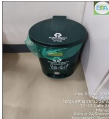
Foto 3. Caneca desechos ordinarios

residuos de barrido, botellas plásticas, papel y vasos desechables, los cuales son dispuestos en bolsas y canecas plásticas de color verde. Estos son dispuestos por la persona asignada del aseo y llevados al lugar de almacenamiento temporal donde posteriormente son entregados a la empresa recolectora PACARIBE S.A.S ESP 3 veces por semana.