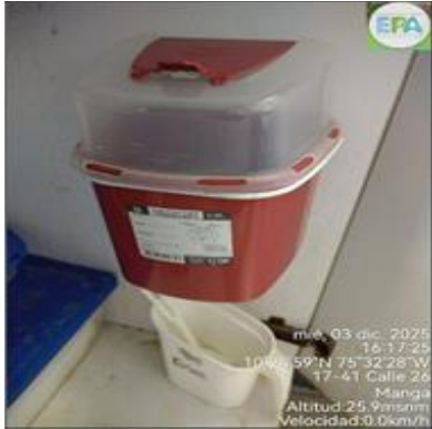
Foto 8. Guardián de seguridad