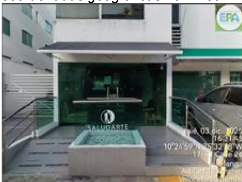
Foto 1. Localización SALUDARTE

Asociación de Profesionales y Odontólogos Especialistas de Cartagena de Indias Arte Odontológico SALUDARTE está localizada en el barrio Manga sobre la avenida Jiménez #17 – 69 edificio Synkar local 1 en la ciudad de Cartagena de Indias D.T. y C. con coordenadas geográficas 10°24'59" N – 75°32'28" O.