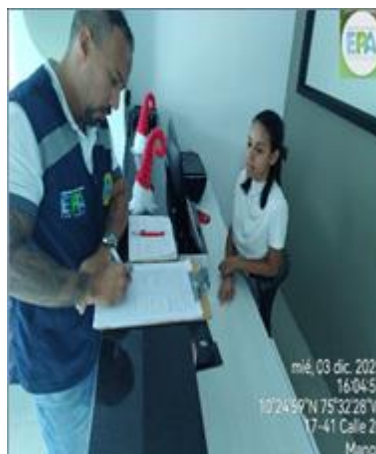
Foto 2. Socialización gestión externa RESPEL