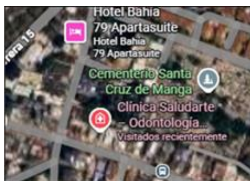
Ilustración 1. Vista satelital SALUDARTE - Google Maps