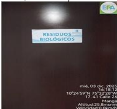
Foto 4. Puerta rotulada almacenamiento

De acuerdo a lo manifestado por la asistente y los servicios que presta la entidad Profesionales y Odontólogos Especialistas de Cartagena de Indias Arte Odontológico SALUDARTE, esta genera residuos de tipo infecciosos o de riesgo biológico como biosanitarios y cortopunzantes. Los residuos cortopunzantes son dispuestos en guardián de seguridad, mientras que los biosanitarios son dispuestos en bolsas plásticas rojas dentro de canecas del mismo color. Características del sitio de almacenamiento temporal de residuos peligrosos. En el sitio de almacenamiento temporal de los residuos generados en la atención en salud y otras actividades, se evidenció que se encuentra en un área definida dentro del inmueble fuera del alcance de los usuarios con puerta rotulada. El área tiene paredes y piso de fácil limpieza con buena iluminación con un área definida de lavado de canecas en el que se evita vertimiento líquido hacia el pasillo, la caneca esta etiquetada y en buen estado. No se tiene dinamómetro propio, por lo tanto, no realizan pesaje de los residuos, sino la empresa recolectora.