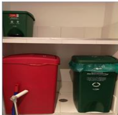
Foto 5. Depósito central de residuos