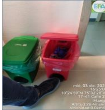
Foto 9. Canecas verde y roja