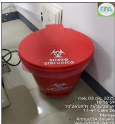
Foto 6. Caneca RESPEL