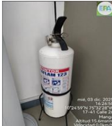
Foto 7. Extintor