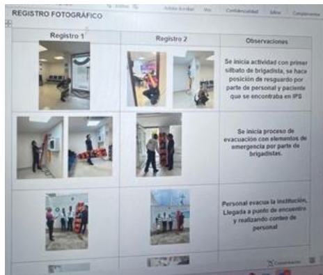
Figura 4 simulacro

CONVACARE CLINICS CARTAGENA Cuenta con el Plan de Contingencia de acuerdo con lo establecido en el artículo 2.2.6.1.3.1. literal h del Decreto 1076 de 2015 que obliga a “Contar con un plan de contingencia actualizado para atender cualquier accidente o eventualidad que se presente y contar con personal preparado para su implementación” y la Resolución 1164 de 2002 en su numeral 7.2.9.2. que obliga a “El Plan de Contingencia formar parte integral del PGIRH – componente interno y debe contemplar las medidas para situaciones de emergencia por manejo de residuos hospitalarios y similares por eventos como sismos, incendios, interrupción del suministro de agua o energía eléctrica, problemas en el servicio público de aseo, suspensión de actividades, alteraciones del orden público, etc.”. Se tiene conformada una brigada, unas herramientas y unas directrices en cada caso para derrames, ruptura de bolsas o cualquier accidente que se presente en el movimiento de los residuos