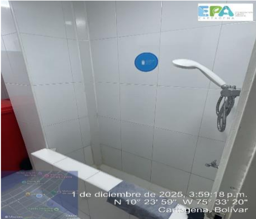
Foto 5. Acometida de agua.