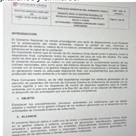
Figura 3 p girasa

El Manual de Procedimientos para la Gestión Integral de los Residuos Hospitalarios y similares, adoptado mediante la resolución 1164 de 2002, exige el diseño e implementación del PGIRH y establece los aspectos que debe contemplar. Durante la visita se verificó que cuenta con un Plan de Gestión Integral de Residuos Generados en la Atención de Salud y otras Actividades (PGIRASA) actualizado el 13 de marzo de 2025 y cumple con las actividades que realiza y protocolo de bioseguridad, diagnóstico de generación de residuos, separación y/o clasificación, conformación del grupo de gestión ambiental y sanitaria, movimiento interno de residuos, recolección interna y externa realizada por el gestor, programa de capacitación, diligenciamiento del formato RH1 y cálculo de indicadores de gestión de residuos hospitalarios y similares.