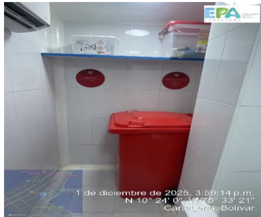
Foto 6. cuarto de almacenamiento