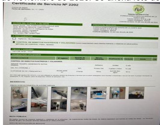
Figura 5. Certificado fumigación.

12. CONVACARE CLINICS CARTAGENA realiza fumigaciones con la empresa FUMIGACIONES ESPECIALES DE LA COSTA de manera trimestral. La última fumigación la realizaron el día 1o de noviembre de 2025. Se anexa foto de certificado.