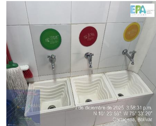
8. Zona de lavado