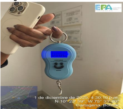
Foto 3. Báscula