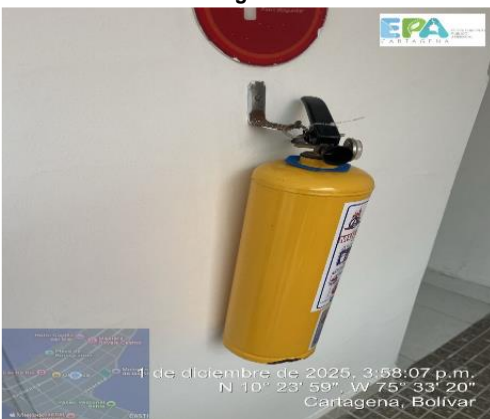
Foto 7. extintor foto