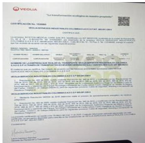
Figura 2. certificado de tratamiento de residuos peligrosos del mes de noviembre 2025

Los RESPEL son entregados a la empresa VEOLIA, la recolección es tres veces por semana para sus respectivos procesos de transporte, desactivación, incineración y posterior disposición final en celdas de seguridad, los vehículos utilizados para la recolección de los residuos generados cuentan con características especiales como identificación, sistema de aseguramiento de la carga, condiciones técnicas entre otros como lo contempla el artículo 5° del Decreto 1609 de 2002. La entidad cuenta con las actas de disposición final entregadas por el gestor, así como los manifiestos de transporte dando cumplimiento a lo establecido en el Decreto 4741 de 2005 compilado en el artículo 2.2.6.1.4.1 del Decreto único reglamentario del sector ambiente y desarrollo sostenible 1076 de 2015.