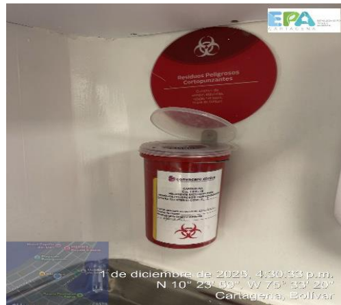
foto 4. Guardian