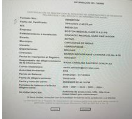
Figura .4 cierre de respel