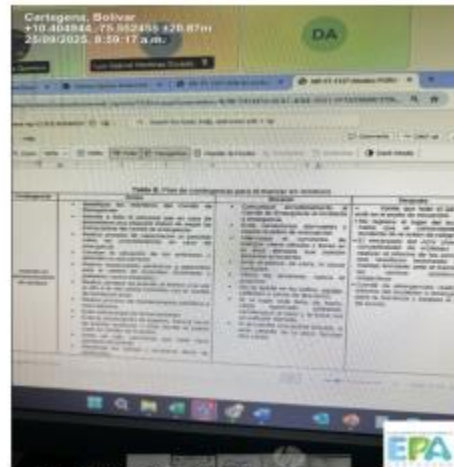
Foto 12. Plan de contingencia

CENTRO MEDICO COOMEVA MEDICINA PREPAGADA S.A., cuenta con el Plan de contingencia de acuerdo con lo establecido en el artículo 2.2.6.1.3.1. literal h del decreto 1076 de 2015.