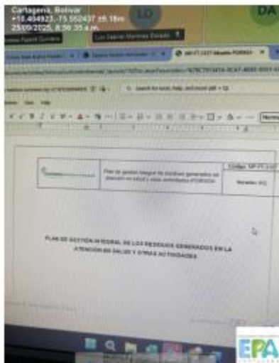
Foto 9. PGIRASA

Durante la visita se verificó que cuenta con un Plan de Gestión Integral de Residuos Hospitalarios (FT-MP-GR01) con fecha de actualización abril de 2024, el cual cumple con las actividades que realiza y protocolo de Bioseguridad, diagnóstico de generación de residuos, separación y/o clasificación, conformación del grupo administrativo de gestión ambiental y sanitaria, movimiento interno de residuos, recolección interna y externa realizada por el gestor. CENTRO MEDICO COOOMEVA MEDICINA PREPAGADA S.A., presentó actas de las reuniones mensuales realizadas por el Grupo Administrativo de Gestión Ambiental (GAGA), evidenciando cumplimiento con lo establecido en el Manual de Procedimientos para la Gestión Integral de los Residuos Hospitalarios y similares.