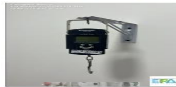
Foto 7. Balanza