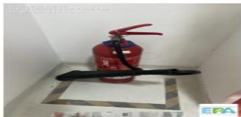
Foto 6. Extintor