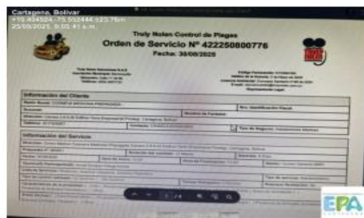
Foto 13. Certificado de fumigación

Realiza fumigaciones cada tres meses con la empresa Truly Noleb Control de Plagas. La última fumigación la realizaron el 30 de agosto de 2025.