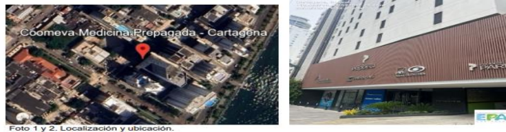
Foto 1 y 2. Localización y ubicación.