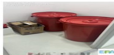
Foto 5. Almacenamiento RESPEL