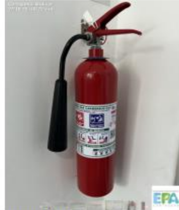
Foto 5, Extintor