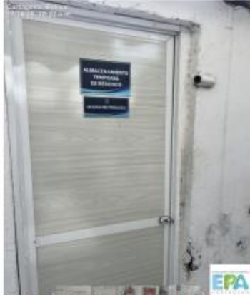
Foto 4, Rotulado de puerta RESPEL