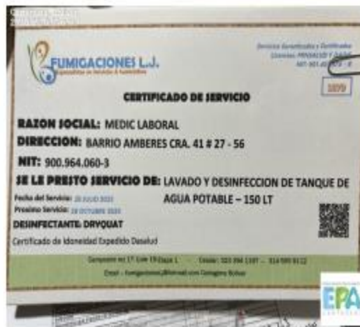
Foto 10. Certificado de fumigación

MEDIC LABORAL S.A.S. Presento el certificado de fumigación la cual se realizó el 28 de julio 2025 con la empresa FUMIGACIONES L.J