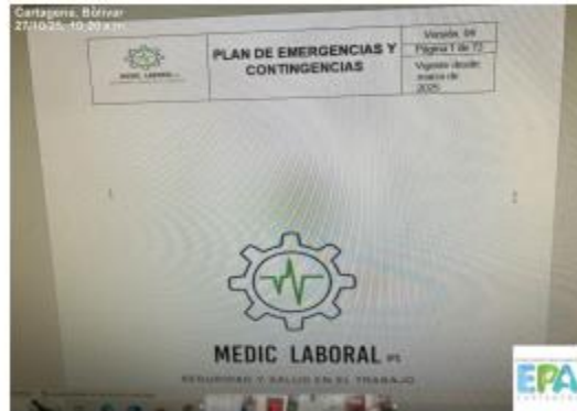
Foto 9. Plan de contingencia.

MEDIC LABORAL S.A.S. no cuenta con el Plan de contingencia de acuerdo con lo establecido en el artículo 2.2.6.1.3.1. literal h del decreto 1076 de 2015. No tienen conformada una brigada, no cuenta con herramientas y directrices en cada caso para derrames, ruptura de bolsas o cualquier accidente que se presente en el movimiento interno de los residuos.