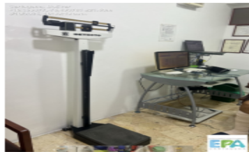
Foto 6, Equipo Medico