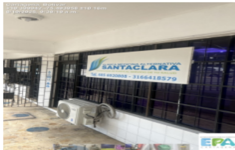
Foto 1 y 2. Localización y ubicación.

CLINICA MEDICINA ALTERNATIVA SANTA CLARA genera durante el primer semestre de 2025 un total de 11,2 Kg de residuos peligrosos, con un promedio mensual de 1,8 Kg/mes clasificándose como micro generador según las categorías establecidas en el artículo 2.2.6.1.6.2 del Decreto único reglamentario del sector ambiente y desarrollo