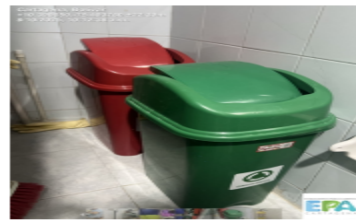
Foto 5, Clasificación