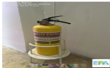
Foto 4, Extintor

No cuentan con cuarto de almacenamiento temporal de los residuos hospitalarios y similares, los que se generan por los servicios son dispuestos para su recolección con la empresa de residuos ordinarios PACARIBE, manifestando que solo son batas que utilizan algunas veces con los pacientes.