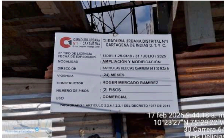
Ilustración 2: Valla informativa del proyecto.

Al momento de la visita, se logró evidenciar que el proyecto cuenta con la valla informativa por parte de la curaduría # 1 con el número de radicación y la fecha 13001-1-25-0418 de 2025, y la licencia de construcción 0418 31 de julio del 2025, Uso Comercial 1