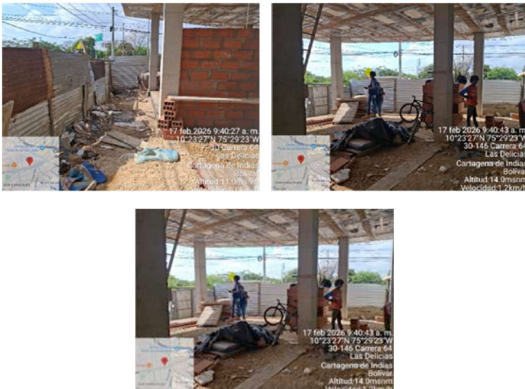
Ilustración 6: clasificación de los RCD.