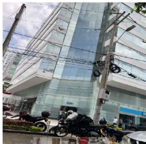
Foto 1 y 2. Localización y ubicación