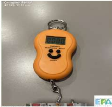
Foto 9. Bascula