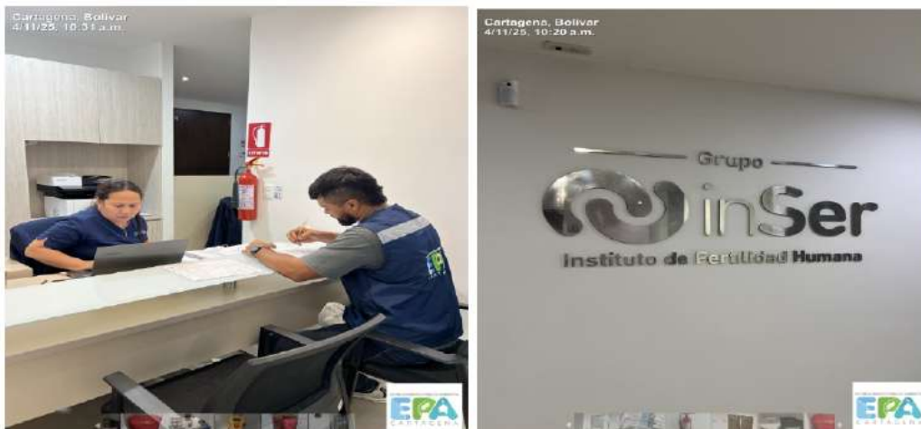
Foto 3 y 4, Socialización RESPEL