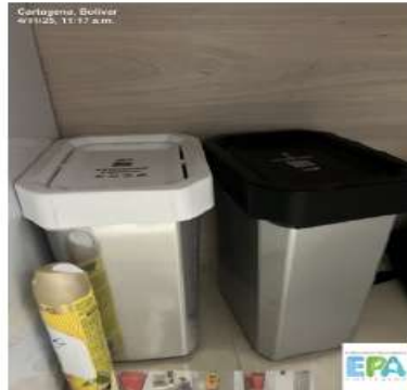
Foto 10. Disposición RESPEL