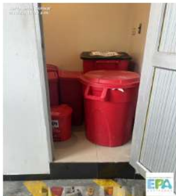
Foto 7, Disposición RESPEL