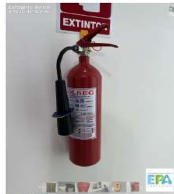
Foto 8, Extintor