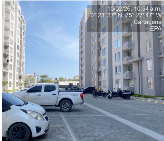
Figura 2. Proyecto cabo alto parque Heredia.