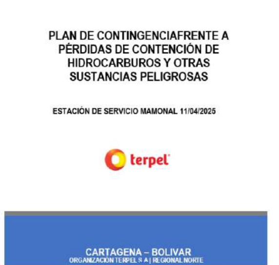
Figura 10. Plan de contingencia

La ORGANIZACIÓN TERPEL- EDS MAMONAL dispone de un plan de contingencia para el manejo de derrames de hidrocarburos o sustancias nocivas, además, orientado a la prevención, preparación y respuestas ante emergencias que puedan presentarse en el desarrollo de sus operaciones. Este documento se encuentra actualizado (año 2025), han realizado capacitaciones a todo el personal sobre el plan de contingencia, presentaron evidencias que respaldan esta actividad y presentaron el radico EXT-AMC-25-0045957 del 11 de abril 2025 correspondiente al informe de cumplimiento del PDC año 2024 presentado ante esta autoridad ambiental.