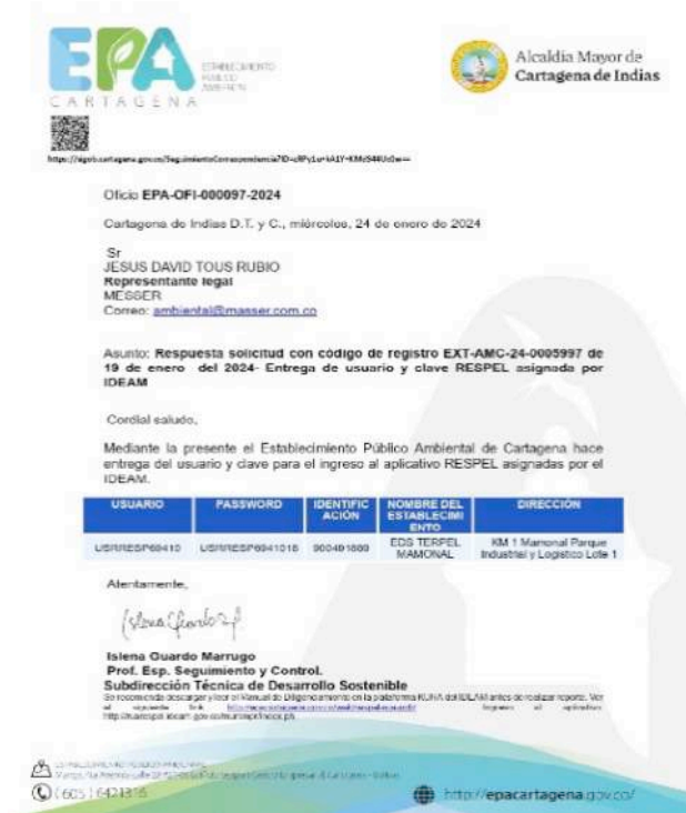
Figura 10. EPA-OFI-000097-2024

La EDS ha realizado la gestión para la inscripción como generador de residuos peligrosos ante el Registro Único Ambiental RUA, el cual el Establecimiento Público Ambiental EPA Cartagena mediante el registro EPA-OFI-000097-2024 les hizo entrega de usuario y contraseña para el reporte de los mismos, sin embargo, la EDS debe realizar la inscripción de sus RESPEL en la plataforma actualizada del IDEAM.