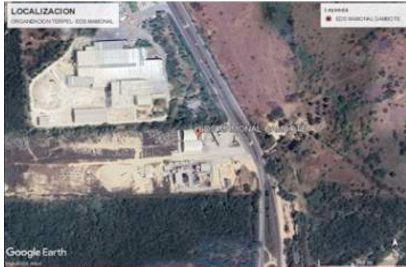
Figura 2. LOCALIZACION ORGANIZACIÓN TERPE- EDS MAMONAL

. La actividad económica principal de la estación corresponde a los códigos CIU 4731 y 4732 definidos como: