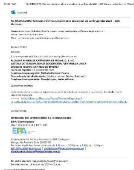
Figura 11. Radicado