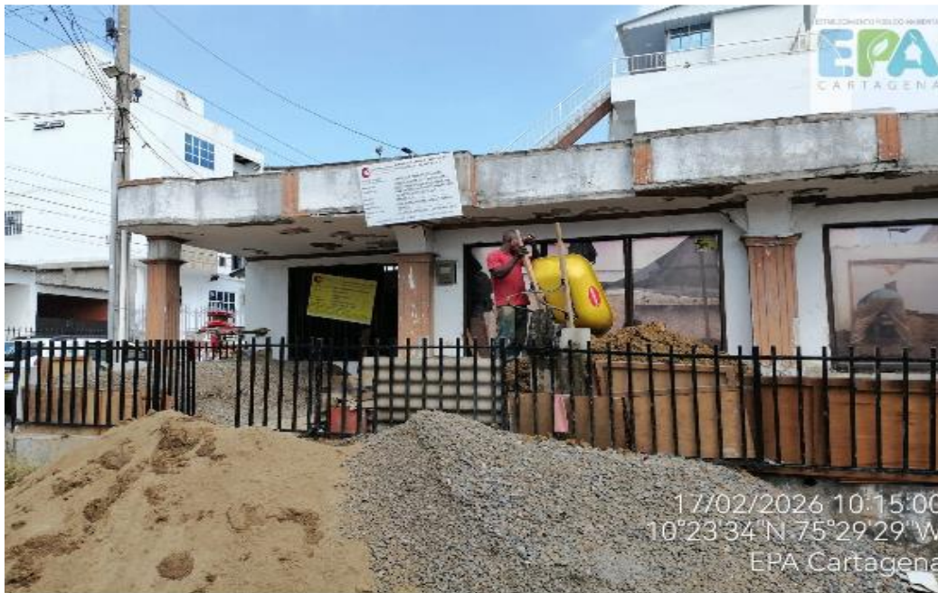
Ilustración 2: Valla informativa del proyecto.

Al momento de la visita, se logró evidenciar que el proyecto cuenta con la valla informativa por parte de la curaduría # 1 con el número de radicación y la fecha 13001-1-25-0769 de 2025, y la licencia de construcción 0691 del 18 de diciembre del 2025, Uso Residencial Unifamiliar (VIS) Comercial 1