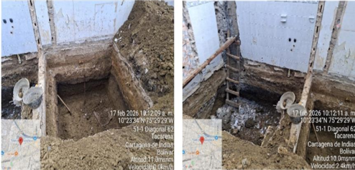
Ilustración4: actividad desarrollada en la construcción.

El proyecto está en un avance del 5 % del cual se estaban realizando actividades de excavaciones para zapatas, del cual se pretende hacer un local comercial el primer piso y el segundo piso apartamento (VIS) y demás, actualmente cuentan con PIN GENERADOR, # del pin 1-1547-001, del cual tiene fecha de inicio 12 de febrero del 2026 con fecha de finalización 12 de febrero del 2027, del cual se ha hecho desalojo de los residuos de construcción y demolición RCD,