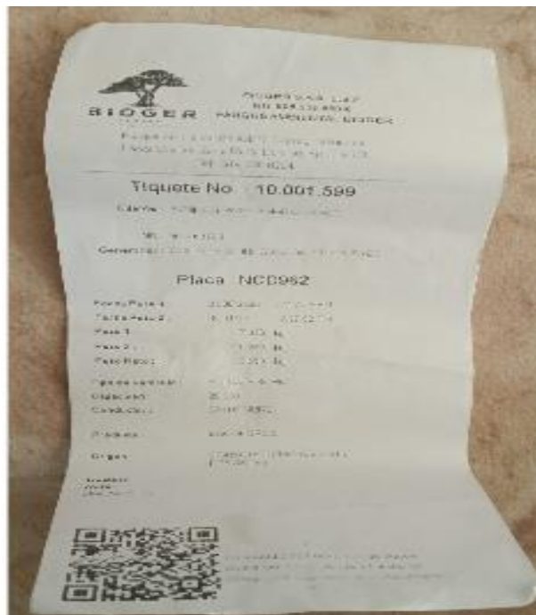
Ilustración 5: certificado de los materiales RCD.