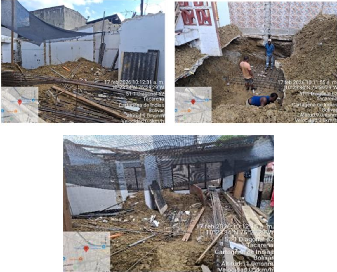
Ilustración 6: clasificación de los RCD.