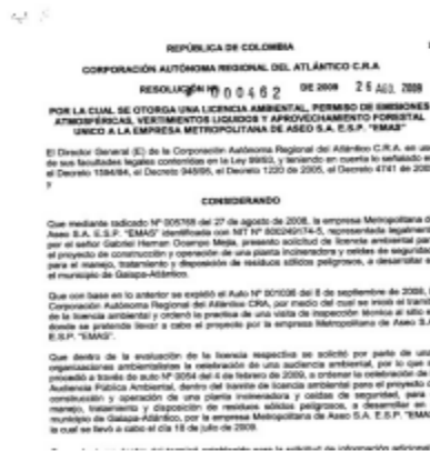
Imagen 6. Resolución