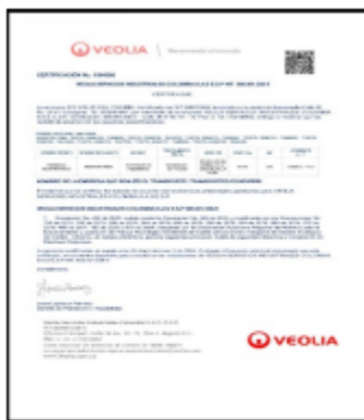
Imagen 7. Certificado de disposición final

Durante la visita el establecimiento presentó el certificado del tratamiento y/o disposición final de residuos peligrosos por parte de la empresa VEOLIA, correspondiente al año 2025, cumpliendo lo establecido en la Resolución 591 de 2024, numeral 4.2.3 (Condiciones generales para los gestores de residuos peligrosos generados en atención en salud y otras actividades).