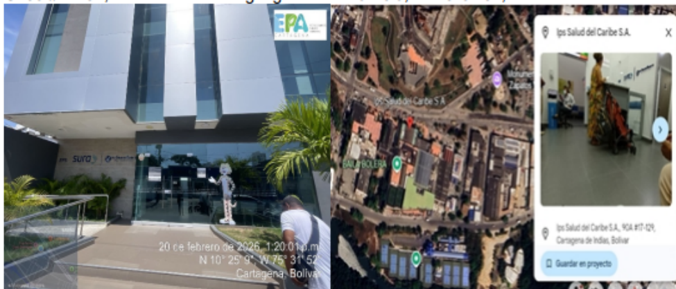
Imagen 1 y 2. Vista satelital y localización ips salud del caribe - fuente GoogleMap

IPS SALUD DEL CARIBE S.A, está localizada en el barrio barrio pie de la popa barrio Pie de la Popa Cr.30 #21–51, con coordenadas geográficas N10°25'9", w" 75°31'52",