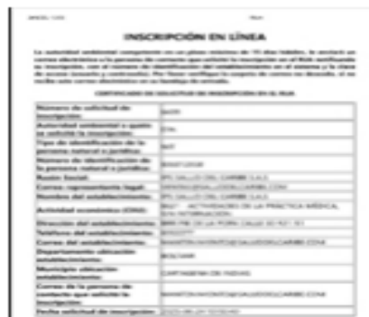
gen 2 inscripción RUA

Se encuentra inscrito en el Registro Único Ambiental RUA desde el día 04 de julio de 2025, dentro del plazo establecido en el artículo 15 de la resolución 839 de 2023, establecido entre el 1° de septiembre a 30 de noviembre del 2025 para último dígito de NIT entre 5 y 9. Debe realizar el cargue del periodo de balance del año 2025, teniendo en cuenta el plazo establecido que se ubica entre el 15 de marzo al 30 de abril del año 2026, para último dígito de NIT entre 5 y 6, acorde al mismo artículo de la misma resolución.