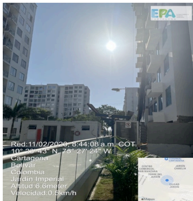
Figura 3. Ubicación de la malla perimetral del proyecto JARDIN IMPERIAL

Por otra parte, se evidenció que la malla perimetral del edificio no se encuentra debidamente instalada, situación que facilita la dispersión y escape de material particulado hacia el exterior del área del proyecto.