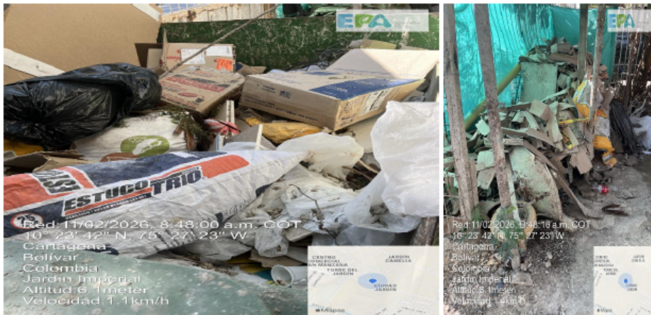
Figura 2. Puntos de acopio temporal de residuos ordinario

Adicionalmente, se observó la existencia de un shut de residuos en el que no se evidencia la debida separación en la fuente, encontrándose incluso algunos residuos contaminados con material de RCD (Residuos de Construcción y Demolición) . El personal manifestó que dichos residuos son entregados como ordinarios a la empresa prestadora del servicio Pacaribe.