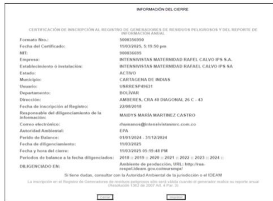
Imagen 1. Cierre RESPEL periodo 2024.

INTENSIVISTAS MATERNIDAD RAFAEL CALVO IPS S.A se encuentra inscrito en línea en el registro de generadores de residuos peligrosos SIAC SUBSISTEMA RESPEL desde 22 de agosto de 2018 y ha dado cierre al periodo de balance correspondiente al año 2024 con fecha 11 de marzo de 2025, dando cumplimiento con lo establecido en el artículo 5 de la resolución 1362 de 2007.