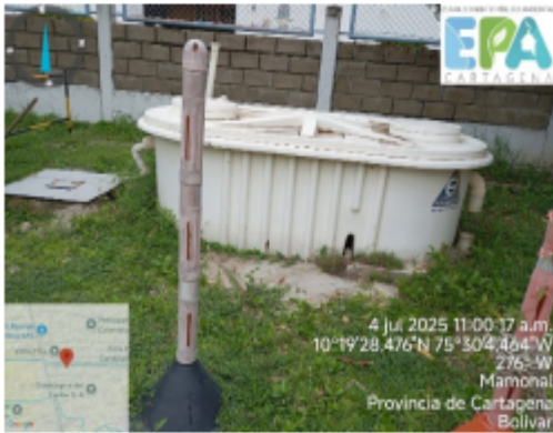
Figura 5. Antigua PTAR

Las aguas residuales domesticas generadas en los baños, lavamanos y lavaplatos, son conducida a la antigua PTRD (no está operando), a la que se le quito una sección del tubo que se comunicaba con un registro desde donde se descargaba al Canal Propilco.