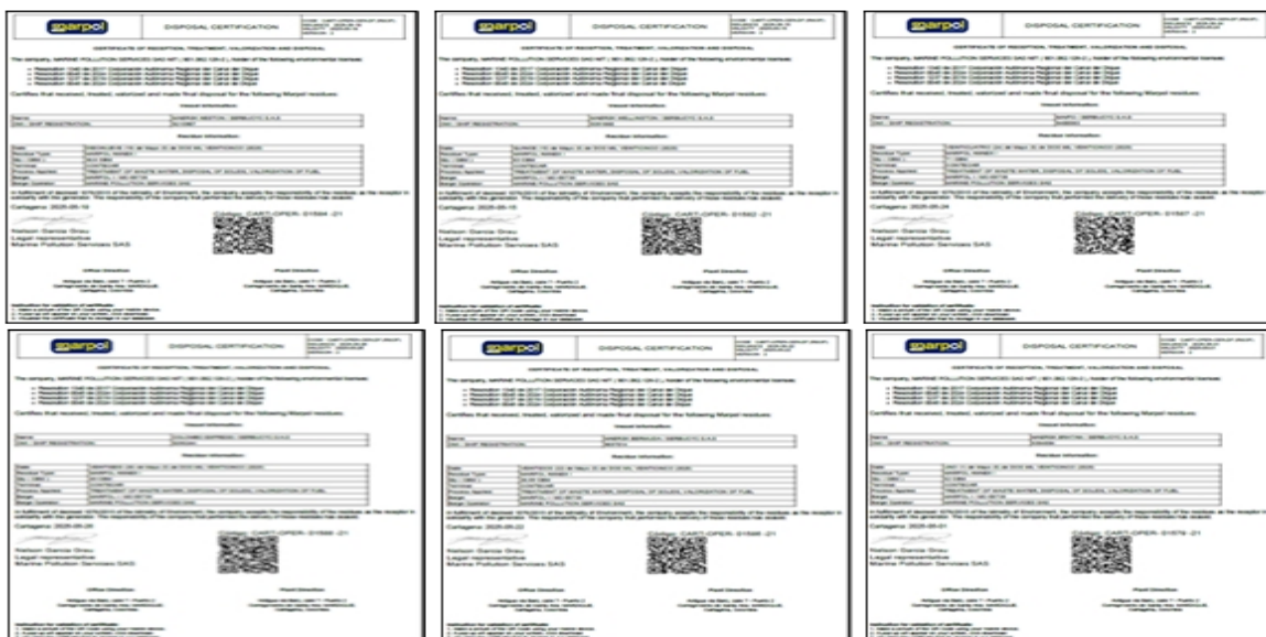
Figuras 4, 5, 6, 7, 8, 9, 10, 11, y 12. Certificados de disposición de aguas de sentinas, emitidos por MARPOL