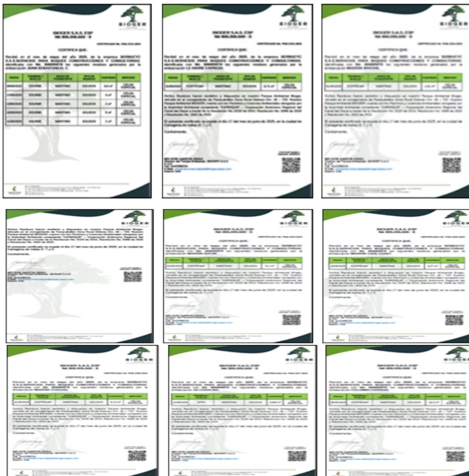
Figuras 16, 17, 18, 19, 20, 21, 22, 23, 24. Certificados de disposición de residuos sólidos no peligrosos emitidos por BIOGER S.A.S. (mes de mayo)

Los residuos sólidos no peligrosos que son recolectados y transportados por SERBUCYC S.A.S., provenientes de las embarcaciones (barcos de carga y/o cruceros) que arriban a los diferentes puertos de Cartagena, son almacenados en 3 contenedores, de los cuales 2 tienen capacidad para 13 m3 y 1 tiene capacidad para 15 m3; estos residuos son gestionados para su disposición final por la empresa BIOGER S.A.S. ESP, identificada con Nit 806006669-8.