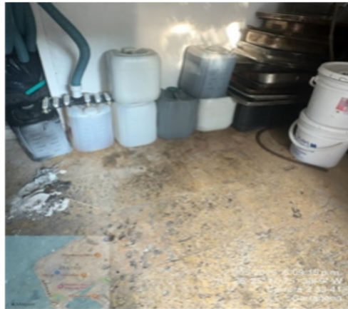
Figura 3: Almacenamiento temporal de ACU

Los aceites usados resultado de la operación de la cocina son almacenados en pimpinas plásticas ubicados cerca de la cocina los cuales no se encuentran debidamente sellados, señalizados, no cuentan con un kit antiderrames, estibas antiderrames, que permitan tomar acciones de contingencia en caso de derrames.