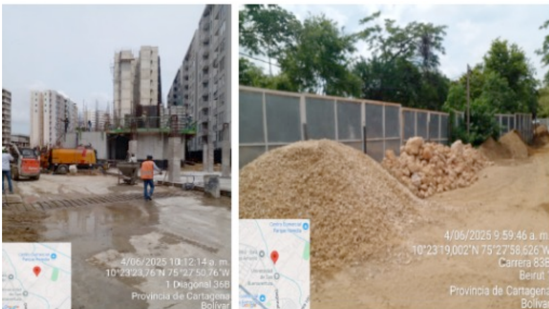
Figura 2. Desarrollo de actividades constructivas realizadas por el proyecto BALTICO.

Durante la visita se observó que el proyecto Báltico cuenta con puntos establecidos para el acopio temporal de residuos ordinarios y RCD dentro de la obra. Sin embargo, se evidenció que el área destinada al almacenamiento de residuos y materiales peligrosos no dispone de un dique de contención y estos se encuentran almacenados directamente sobre el suelo.