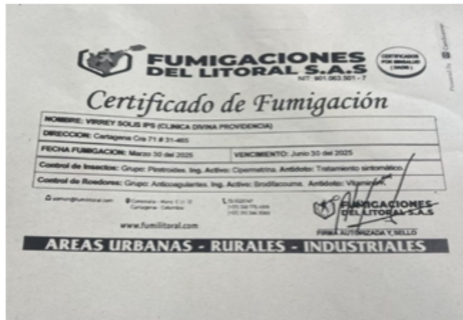
Imagen 7. Certificado FUMIGACIONES DEL LITORAL S.A.S.