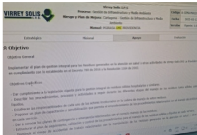
Imagen 4. PGIRASA

Durante la visita se verificó que cuenta con un Plan de Gestión Integral de Residuos Generados en la Atención de Salud y otras Actividades (PGIRASA) actualizado el 10 de junio de 2025 y cumple con las actividades que realiza y protocolo de bioseguridad, diagnóstico de generación de residuos, separación y/o clasificación, conformación del grupo de gestión ambiental y sanitaria, movimiento interno de residuos, recolección interna y externa realizada por el gestor, programa de capacitación, diligenciamiento del formato RH1 y cálculo de indicadores de gestión de residuos hospitalarios y similares.