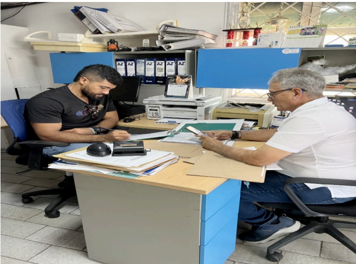
foto 2. Socialización gestión externa RESPEL