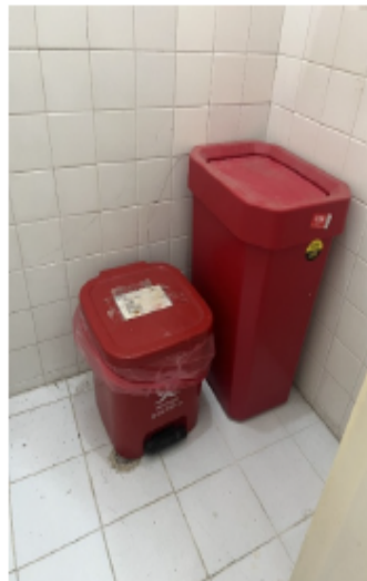
foto 4. Disposición de Respel