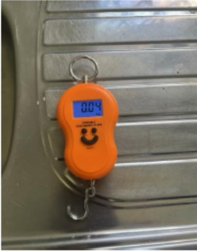
Foto 5. Bascula