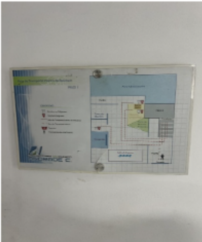
foto 7 Ruta de evacuación