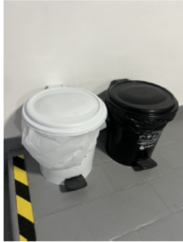
foto 6. Clasificación