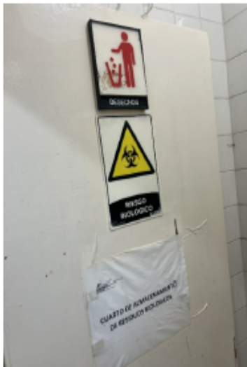
foto 3. Cuarto de almacenamiento