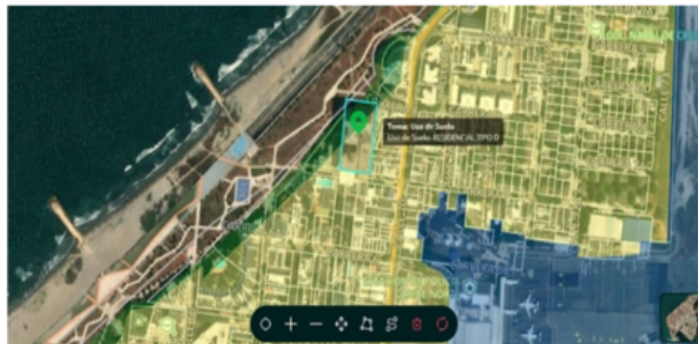
Figura 1. Ubicación geográfica proyecto DEMOLICION Y OBRA NUEVA CARTAGENA BEACH. Fuente: MIDAS, 2025.

La visita de inspección fue atendida por Fredy Castellanos identificado con numero de cedula de ciudadanía 1.047.362.840, con correo fcastellanos@gruponl.com.co y numero de contacto 3107211927, quien actuó en calidad de encargado de sistema de gestión de seguridad y salud en el trabajo.