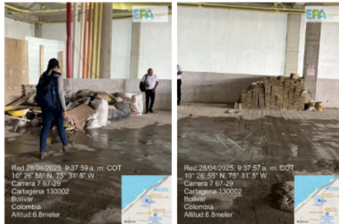
Figura 3. Zona de parqueadero interno y Acopio de RCD.

Asimismo, se observó que parte de los RCD se encuentran depositados directamente sobre el suelo, mientras que otros están contenidos en sacos; sin embargo, esta disposición no garantiza una separación diferenciada ni facilita su posterior aprovechamiento o disposición final.