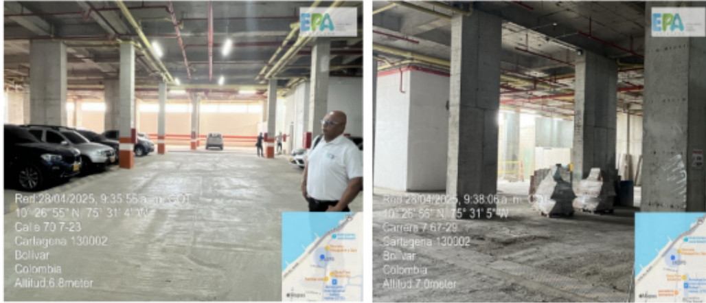
Figura 2. Actividades constructivas del proyecto CARTAGENA BEACH Fuente: Autores, 2025

Al momento de la visita se evidencio que el proyecto se encuentra en un porcentaje de avance de obra del 95%, realizando actividades de adecuaciones internas de los apartamentos, así mismo, se evidenciaron trabajos correspondientes a actividades de acabados en el parqueadero interno del proyecto.