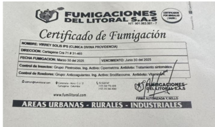
Imagen 6. Certificado fumigación.

VIRREY SOLI IPS S.A CLINICA DIVINA PROVIDENCIA realiza fumigaciones con la empresa FUMIGACIONES DEL LITORAL de manera trimestral. La última fumigación la realizaron el día 30 de marzo de 2025. Se anexa foto de certificado.