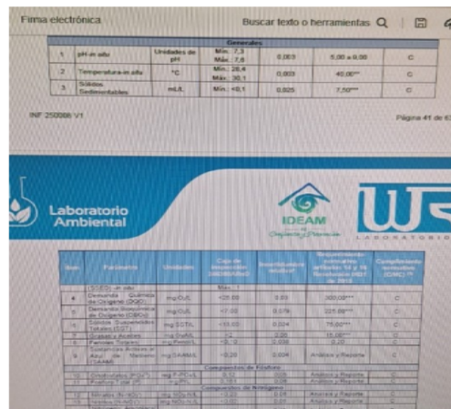
Imagen 2. Resultado de agua residuales no domestica

VIRREY SOLI IPS S.A CLINICA DIVINA PROVIDENCIA: genera aguas residuales no domésticas. Durante la visita presentó los resultados con toma de muestra realizada el día 11 diciembre de 2024 por el WR laboratorio.