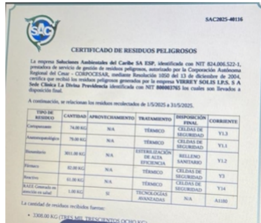
Imagen 2. certificado de tratamiento de residuos peligrosos mayo 2025

Se anexó certificado de tratamiento y disposición final de residuos por soluciones ambientales del caribe S.A ESP del mes de mayo con un total de 3.308kg clasificados según las corrientes: