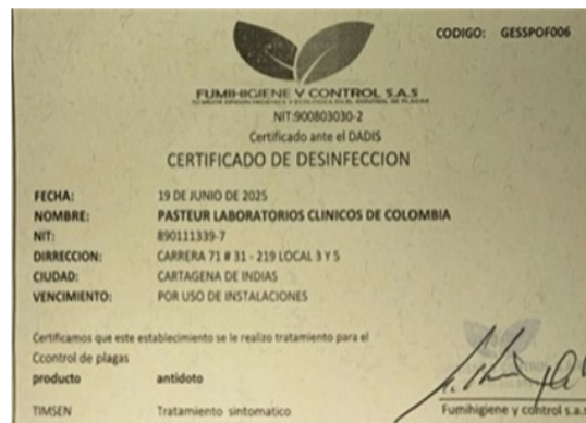
Imagen 7. Certificado FUMIHIGIENE Y CONTTOL S.A.S.

PASTEUR LABORATORIOS CLINICOS DE COLOMBIA SA, Realiza fumigaciones con la empresa FUMIHIGIENE Y CONTROL S.A.S La última fumigación la realizaron el día 20 de junio 2025, con periodicidad trimestral.