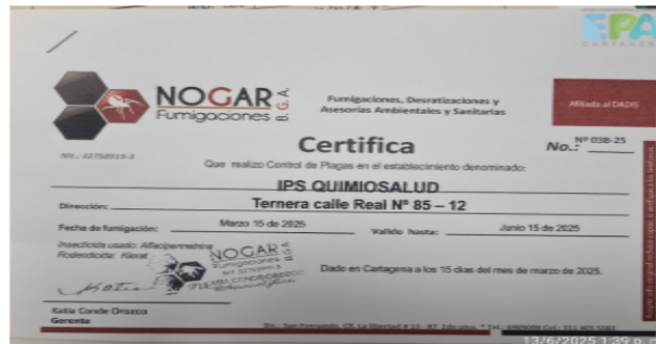
Foto 8. Certificado Fumigación.

con la empresa NOGAR Fumigaciones. La última fumigación la realizaron el día 15 de marzo 2025, con periodicidad trimestral.