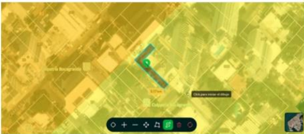
Figure 1. Ubicación geográfica del proyecto donde se pretenden realizar actividades constructivas en modalidad de demolición total y obra nueva.

El día 7 de mayo del 2025 a las 12:30 p.m., se realizó visita de inspección al posible proyecto constructivo PROMOTORA ZOKU BAY S.A.S identificada con el NIT 901424178-0. El predio donde se pretenden realizar las actividades generadoras de RCD se encuentra ubicado en el barrio Bocagrande carrera 4 #6 – 133, en las coordenadas geográficas 10°24'1" N 75°33'20" W. Teniendo en cuenta la distribución espacial del Distrito de Cartagena de Indias, el proyecto se encuentra ubicado en la localidad 1, Histórica y del caribe Norte, en la unidad comunera de gobierno N°1, y cuenta con la matricula inmobiliaria 060-29842, 060-23392, 060-72026 y 060-7787 y la referencia catastral 010100430016000.