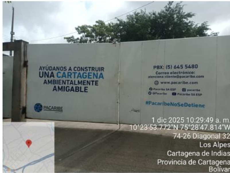
Figura 1: Localización de la empresa PACARIBE S.A.S E.S.P.

En la visita de inspección se pudo verificar que la empresa realiza actividades como recolección y transporte desde las instalaciones del cliente hasta el sitio de acopio temporal y aprovechamiento final de sustancias peligrosas y no peligrosas. Así mismo, se pudieron videnciar los siguientes aspectos: