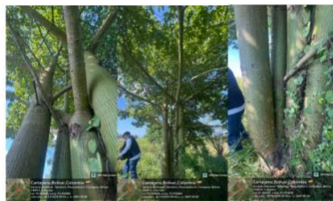
Imagen 4: Bonga (Ceiba pentandra) árbol multifurcado, estado fitosanitario bueno