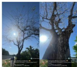
Imagen 3: Bonga (Ceiba pentandra) N° 1 – Árbol muerto en pie