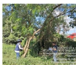
Imagen 6: Acacia (Leucaena leucocephala) – ubicación del ejemplar