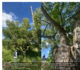
Imagen 5: Neem (Azadirachta indica) – Ubicación del ejemplar, estado fitosanitaria bueno