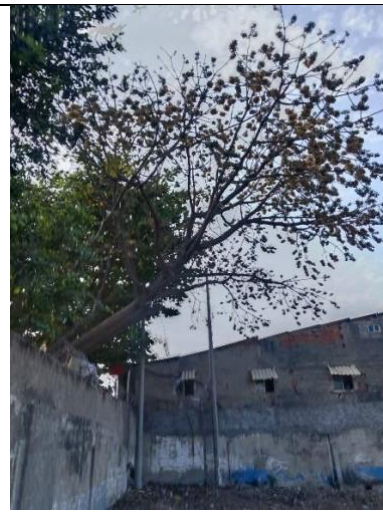
Ilustración 4. poda técnica de la rama por obra civil