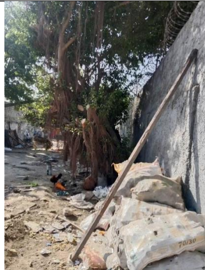
Ilustración 2. inclinación severa en el fuste