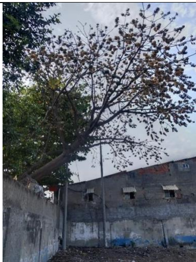
Ilustración 3. Poda técnica de formación