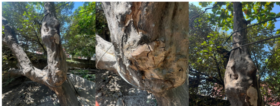
ENTRELAZAMIENTO CON CABLEADO DE TELEFONIA