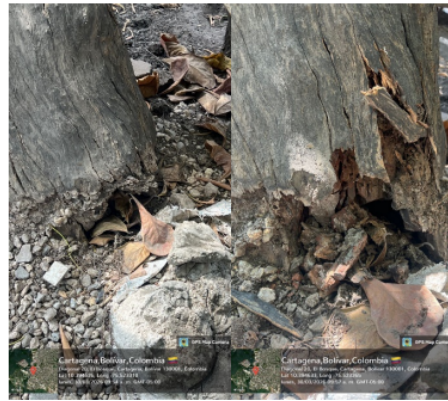
AFECTACION EN LA ZONA BASAL