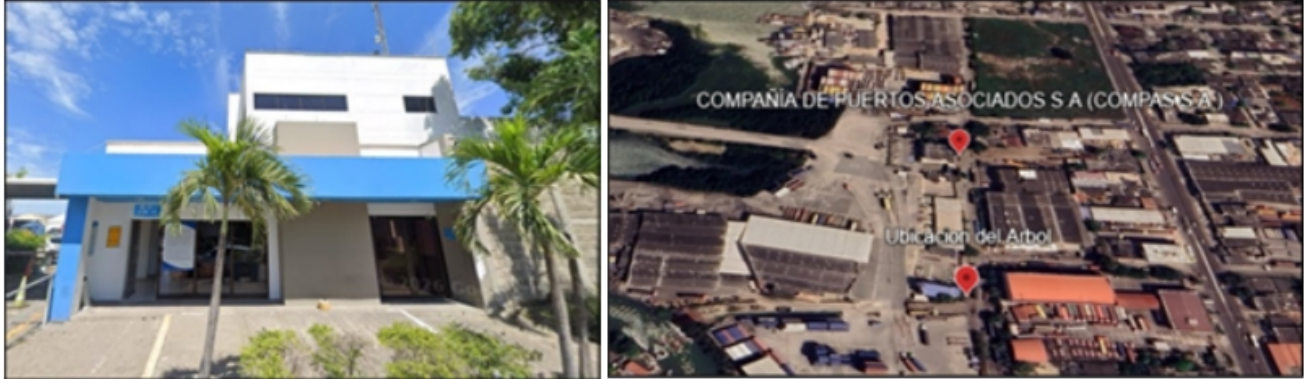
Imagen 1: Ubicación de Compañía De Puertos Asociados S.A (Compas S.A.), barrio el bosque, avenida Pedro Vélez No. 48-14 Cartagena de Indias, Bolívar

(COMPAS S.A.), donde solicita ante el establecimiento público ambiental EPA - Cartagena Autorizar la tala del árbol ubicado dentro de las instalaciones, en atención al riesgo que este representa para la seguridad de las personas, la infraestructura y la operación de la compañía.