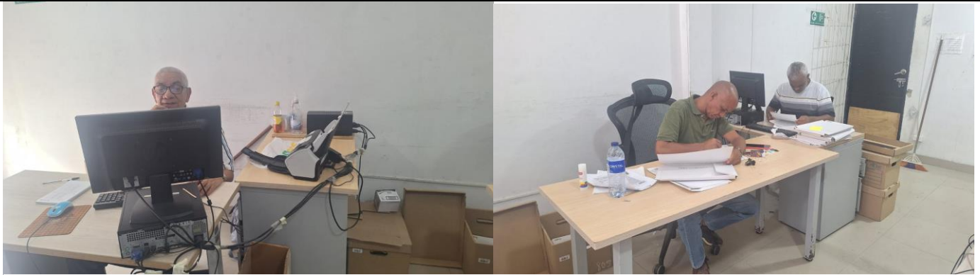
Situación actual Archivo central