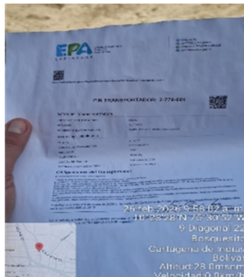
Ilustración 6: certificado del pin transportador. Fuente: Autores Edgar cano