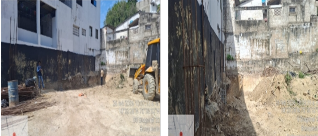
Ilustración7: material de excavación RCD.