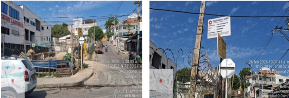
Ilustración 2: Valla informativa del proyecto.

Al momento de la visita, se logró evidenciar que el proyecto cuenta con la valla informativa por parte de la curaduría # 1 con el número de radicación y la fecha 13001-1-25-0137 de 2025, y la licencia de construcción 0343 18 de junio del 2025, Residencial Bifamiliar.