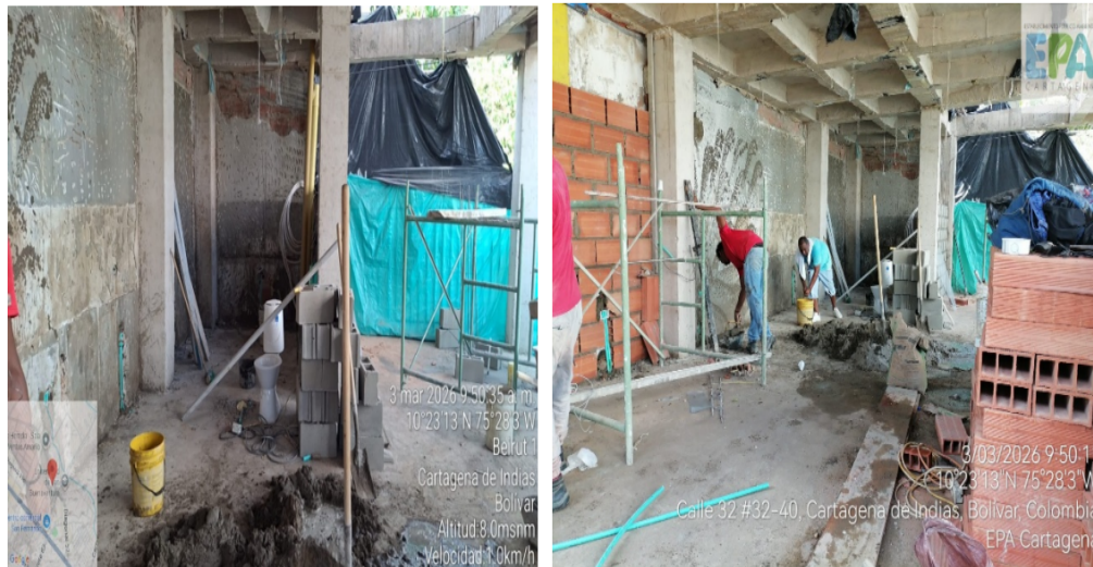
Ilustración 4: actividad desarrollada en la construcción.

Adicionalmente, se evidencio que el proyecto de la señora KAREN CATALINA Menco UTRIA se encontraba desarrollando actividad de pañete de muro.