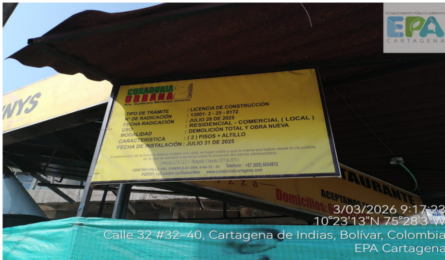
Ilustración 2: Valla informativa del proyecto.

Al momento de la visita, se logró evidenciar que el proyecto cuenta con la valla informativa por parte de la curaduría #2 con el número de radicado 13001- 2 – 25 - 0172 del 28 de julio del 2025 con características de 2 pisos más altillo.