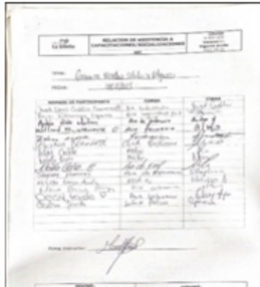
Imagen 8. Asistencia de capacitación

CLINICA LA ERMITA DE CARTAGENA S.A.S (sede urgencia), realiza capacitaciones al personal encargado del manejo y gestión de los RESPEL. Se presentó las asistencias del personal de forma presencial, observando que realizan capacitaciones temas relacionados con el manejo integral de los residuos hospitalarios y similares.