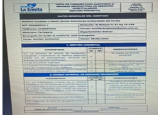
imagen 5. Auditoria

generados, efectivamente la actividad de seguimiento a la empresa que presta el servicio de recolección, transporte, tratamiento y disposición.