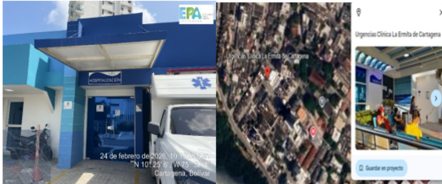
Imagen 1 y 2. Vista satelital y localización clínica ermita urgencia

CLINICA LA ERMITA DE CARTAGENA S.A.S (sede urgencia), está localizada Calle 29 C# 19 – 07 Pie de la Popa, con coordenadas geográficas N10°25'9, w" 75°31'52,"