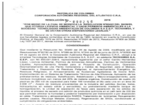
imagen 6. Resolución

CLINICA LA ERMITA DE CARTAGENA S.A.S (sede urgencia), contrató toda la cadena de manejo y gestión externa de los residuos peligrosos generados con la con la empresa SOLUCIONES AMBIENTALES DEL CARIBE, desde la recolección, transporte, tratamiento y disposición final. De la misma manera, se evidencia que el establecimiento posee conocimiento del acto administrativo o Licencia Ambiental expedida por la Autoridad Ambiental que aprueba y autoriza el tratamiento y disposición final.