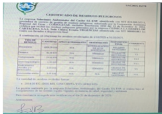
Imagen 7. Certificado de disposición final

Durante la visita el establecimiento presentó el certificado del tratamiento y/o disposición final de residuos peligrosos por parte de la empresa SOLUCIONES AMBIENTALES DEL CARIBE, correspondiente al año 2025, cumpliendo lo establecido en la Resolución 591 de 2024, numeral 4.2.3 (Condiciones generales para los gestores de residuos peligrosos generados en atención en salud y otras actividades).