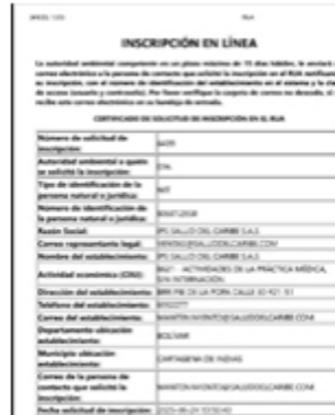
Imagen 2 Inscripción RUA