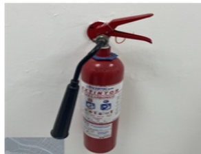
Foto 2. Extintor

Durante el año 2025 los RESPEL son entregado todos los días de la semana, a la empresa SOLUCIONES AMBIENTALES DEL CARIBE para su recolección, transporte, incineración y disposición final de cenizas resultantes en celdas de seguridad. Actualmente estos residuos están siendo recolectados y transportados por la empresa SOLUCIONES AMBIENTALES DEL CARIBE hasta las instalaciones para su tratamiento y disposición final de cenizas resultantes en celdas de seguridad.