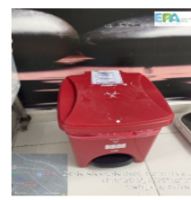
Foto 6. caneca roja