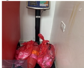
Foto 3. Bascula