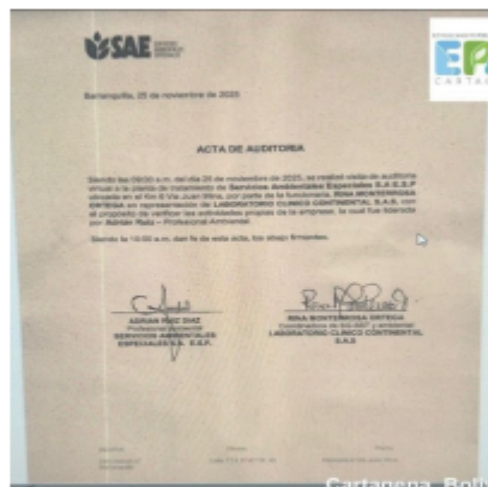
foto 13. Acta de auditoria

De acuerdo con la documentación solicitada durante la visita, se evidenció el seguimiento que le realizan a la empresa transportadora, a través de auditorías como se observa en el acta adjuntada en este informe.