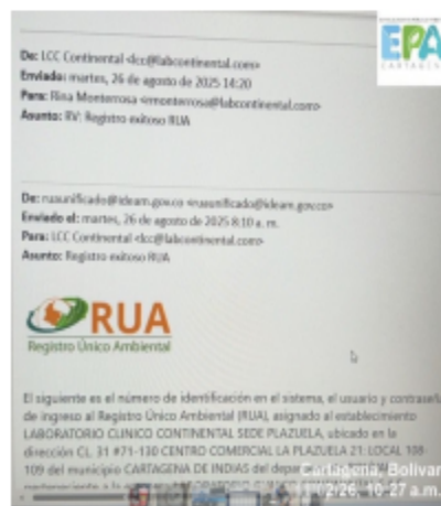
foto 11. Inscripción RUA

LABORATORIO CLÍNICO CONTINENTAL S.A.S. SEDE BOCAGRANDE se encuentra inscrito en el registro único ambiental RUA, desde el 25 de agosto de 2025 dando cumplimiento a lo establecido en el artículo 7 de la Resolución 0839 de 2023 en su calidad de generadores de RESPEL.