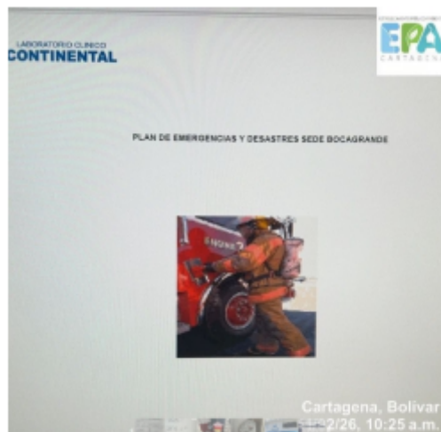
foto 15. Plan de Contingencia

LABORATORIO CLINICO CONTINENTAL S.A.S. cuenta con el Plan de contingencia de acuerdo con lo establecido en el artículo 2.2.6.1.3.1. literal h del decreto 1076 de 2015. Este año no han hecho simulacros con la ARL, cuenta con herramientas y directrices en cada caso para derrames, ruptura de bolsas o cualquier accidente que se presente en el movimiento interno de los residuos.