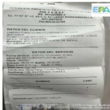
foto 12. Comprobante de Recolección

Durante la visita se evidenciaron los comprobantes de recolección de RESPEL verificándose que los residuos con riesgos biológicos o infeccioso, son recolectados con una frecuencia de dos (2) veces por semana, dando cumplimiento a lo establecido en el numeral 4.2.2.3 de la Resolución 0591 de 2024.