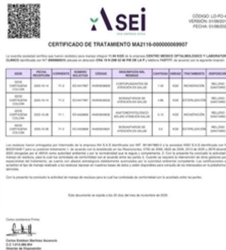
Figura 2. certificado de tratamiento de residuos peligrosos del mes de octubre 2025

Los RESPEL son entregados a la empresa ATICA , la recolección es tres veces por semana para sus respectivos procesos de transporte, desactivación, incineración y posterior disposición final en celdas de seguridad, los vehículos utilizados para la recolección de los residuos generados cuentan con características especiales como identificación, sistema de aseguramiento de la carga, condiciones técnicas entre otros como lo contempla el artículo 5° del Decreto 1609 de 2002. La entidad cuenta con las actas de disposición final entregadas por el gestor, así como los manifiestos de transporte dando cumplimiento a lo establecido en el Decreto 4741 de 2005 compilado en el artículo 2.2.6.1.4.1 del Decreto único reglamentario del sector ambiente y desarrollo sostenible 1076 de 2015.