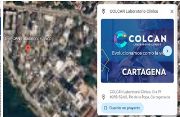
Figura 1. Localización Fuente: Google Earth, N10°25'10"w 75,32°7"