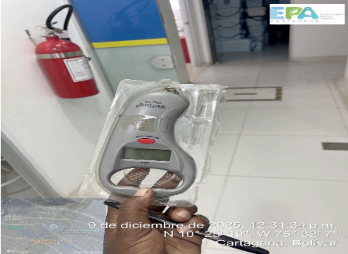
Foto 3. Bascula

Manejan correctamente el código de colores.