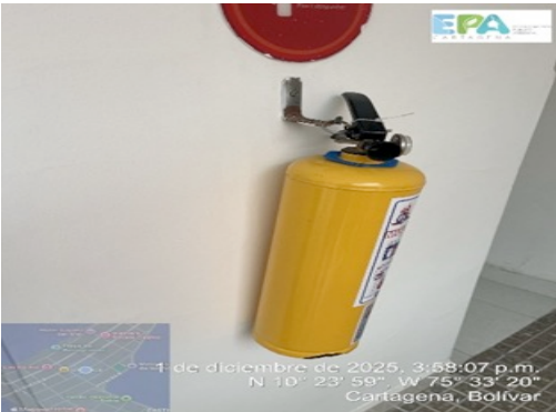
Foto 5. Extintor