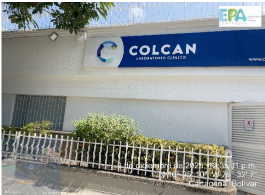
Imagen 1. vista externa del colcan

1. UBICACIÓN GEOGRÁFICA DEL ESTABLECIMIENTO Centro Médico Oftalmológico y Laboratorio Clínico Andrade Narváez SAS – COLCAN está localizada ubicado en el Barrio Pie de la Popa Carrera 19 #29B52, en Cartagena de Indias, con coordenadas geográficas 10°25'10" N – 75°32'7"