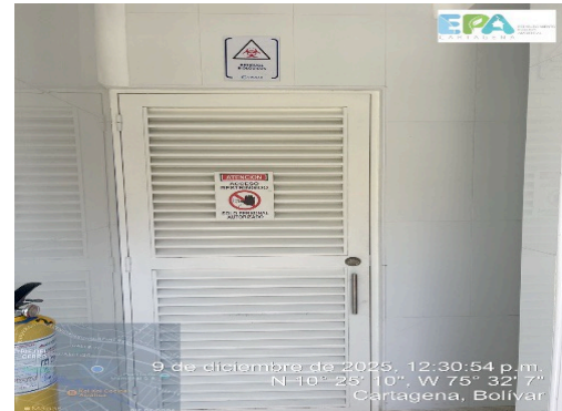
Foto 6. Cuarto de almacenamiento