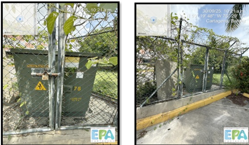
Figura 14. TRANSFORMADOR

OCC LOGISTICS S.A.S. , cuentan con un equipo que aparenta ser transformador, este mismo no se logró evidenciar ni verificar ya que no se encontraba en el sitio la persona que tenía acceso, además informaron que no eran los dueños de este equipo y que no lo usaban.