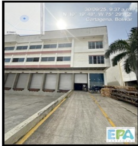
Figura 2. FACHADA DE LA EMPRESA

La visita se llevó a cabo el día 30 de septiembre de 2025 por el área de “Control y Seguimiento” y “Vertimiento”, siendo la 9:30 pm el equipo del EPA Cartagena llegó a las instalaciones de la empresa identificada con NIT: 901461734-3 y con códigos CIU: