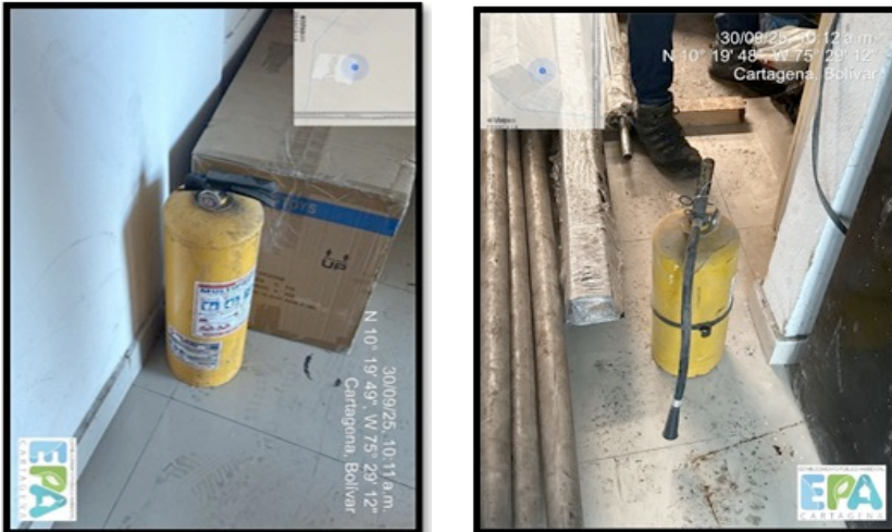
Figura 12. EQUIPOS TÉCNICOS