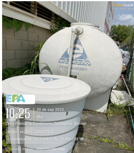
FIGURA 4. PTAR no funcional