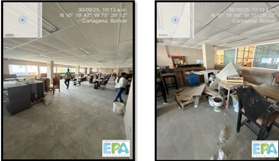
Figura 10. SEGUNDA PLANTA EN ADECUACIÓN

realizar la visita no se evidenció grandes cantidades de residuos de RCD y afirmaron que la adecuación la realiza una empresa externa, no obstante se le sugirió contar de manera inmediata con el PIN para esta adecuación y darle disposición adecuada.