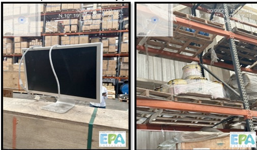
Figura 11. RESPEL

Adicional a lo anterior mencionado, no cuentan con Plan de Gestión de RESPEL, ni sitios adecuado para la contención y protección de estos residuos.