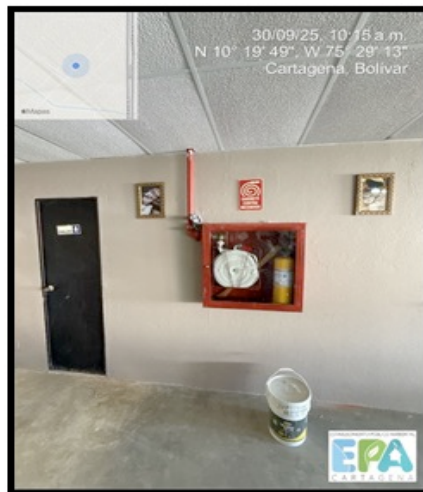
Figura 13. Equipos técnicos