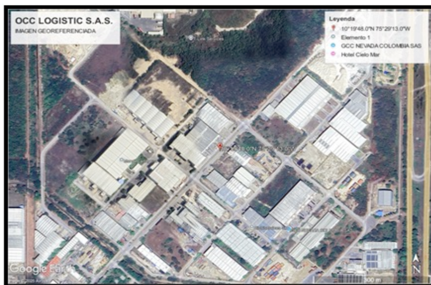
Figura 1. IMAGEN GEOREFERENCIADA DE OCC LOGISTICS S.A.S.

En el marco del cumplimiento de las actividades del Establecimiento Público Ambiental – EPA Cartagena., se realizó visita de control y seguimiento a la empresa OCC LOGISTICS S.A.S. , ubicada en via mamonal km 9 zona franca la candelaria etapa 1 bdg 6-37 y con coordenadas N 10° 19' 48", W 75°29'13".