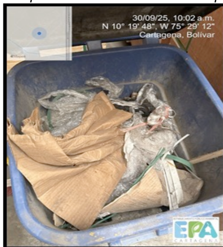
Figura 9. SEGREGACIÓN INADECUADA DE RESIDUOS

Como se mencionó anteriormente, la bodega cuenta con canecas para la disposición de sus residuos, sin embargo, no es eficiente para la correcta segregación de sus residuos, además, informaron que no generaban ningún tipo de residuo, pero a la hora de realizar la inspección se evidenció que esta afirmación no correspondía a lo que se visualizaba.