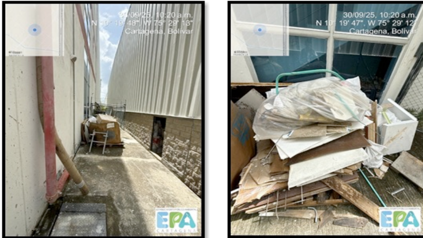
Figura 7. ZONA EXTERNA DE LA BODEGA