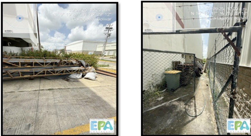
Figura 8. ZONA EXTERNA DE LA BODEGA

Como se mencionó anteriormente, la bodega cuenta con canecas para la disposición de sus residuos, sin embargo, no es eficiente para la correcta segregación de sus residuos, además, informaron que no generaban ningún tipo de residuo, pero a la hora de realizar la inspección se evidenció que esta afirmación no correspondía a lo que se visualizaba.