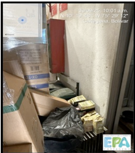
Figura 5. PUNTO ECOLOGICO INFUNCIONAL

OCC LOGISTICS S.A.S., cuenta con un solo punto ecológico como lo establece la resolución 2184 de 2019 “código de colores”, sin embargo, este mismo se evidenció afuncional y, aparentemente sin usarlo. Además de este punto ecológico, cuentan con dos canecas visibles para la contención y almacenamiento de sus residuos, pero estas mismas no corresponden al código de colores anteriormente mencionado. Por otra parte, mencionaron que no contaban con un centro de acopio, sin embargo, en la inspección se pudo observar que en la zona externa estos mismos cuentan con un espacio donde disponen sus residuos, dicha zona, necesita orden y aseo ya que se evidenció con gran cantidad de material.