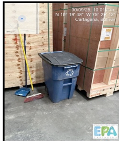
Figura 6. CANECA DE ALMACENAMIENTO DE RESIDUOS