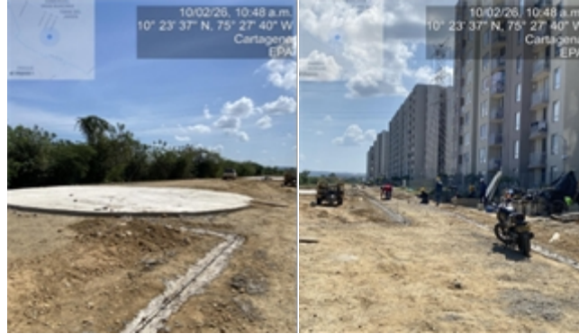
Figura 2. Avance del proyecto URBANISMO ETAPA 5.