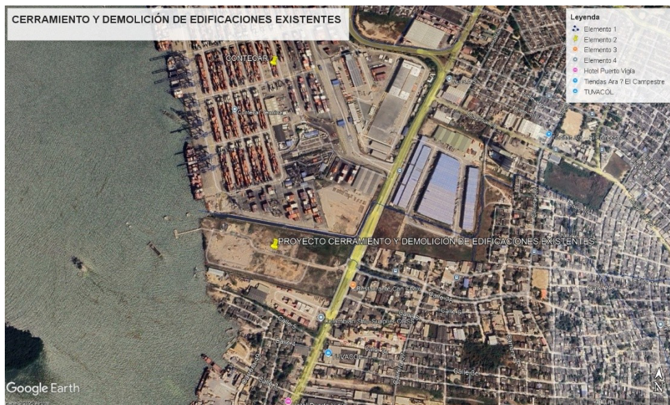
Figura 1. Ubicación geográfica LOTE SUR Contecar

Se realizo visita de inspección a las actividades constructivas contempladas en el proyecto ADECUACION DE TERRENO LOTE SUR, antiguo lote frigopesca el día 02 de diciembre de 2025 a las 3:00 p.m., Dicho proyecto se encuentra ubicado en el barrio Albornoz Sector Mamonal Cra 50 No°5-229, en las coordenadas geográficas 10°22'23.47"N- 75°30'27.17"O. Teniendo en cuenta la distribución espacial del Distrito de Cartagena de Indias, El proyecto se encuentra ubicado en la localidad 3, Industrial y de la Bahía, y cuenta con la matricula inmobiliaria 060-13767 y referencia catastral 011005890004000.