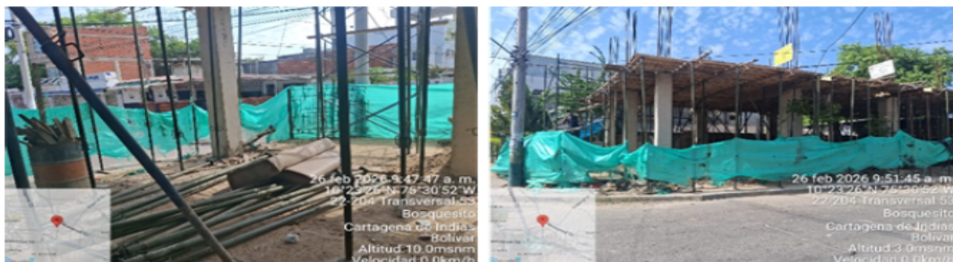
Ilustración 3: proyecto VICTOR AGUIRRE VILLEGAS.