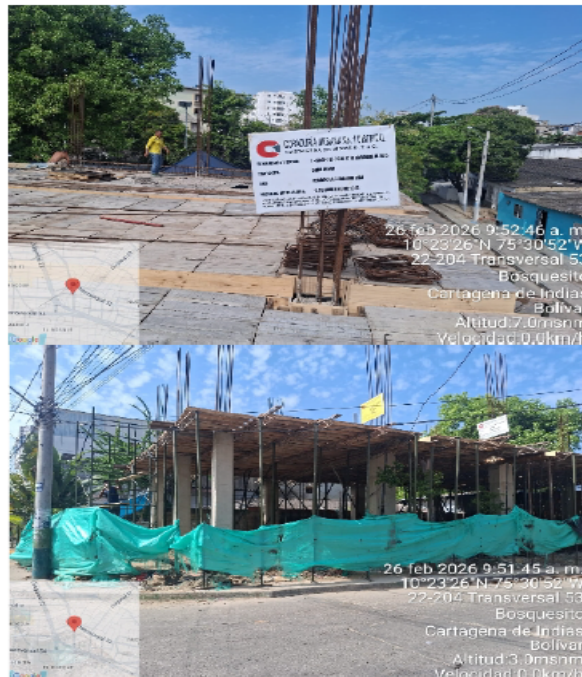
Ilustración 2: Valla informativa del proyecto curaduría #1

Al momento de la visita, se logró evidenciar que el proyecto cuenta con la valla informativa por parte de la curaduría # 1 con el número de radicación y la fecha 13001-1-25-0617 de 2025, y la licencia de construcción 0616 10 de diciembre del 2025, Residencial Bifamiliar (vis).