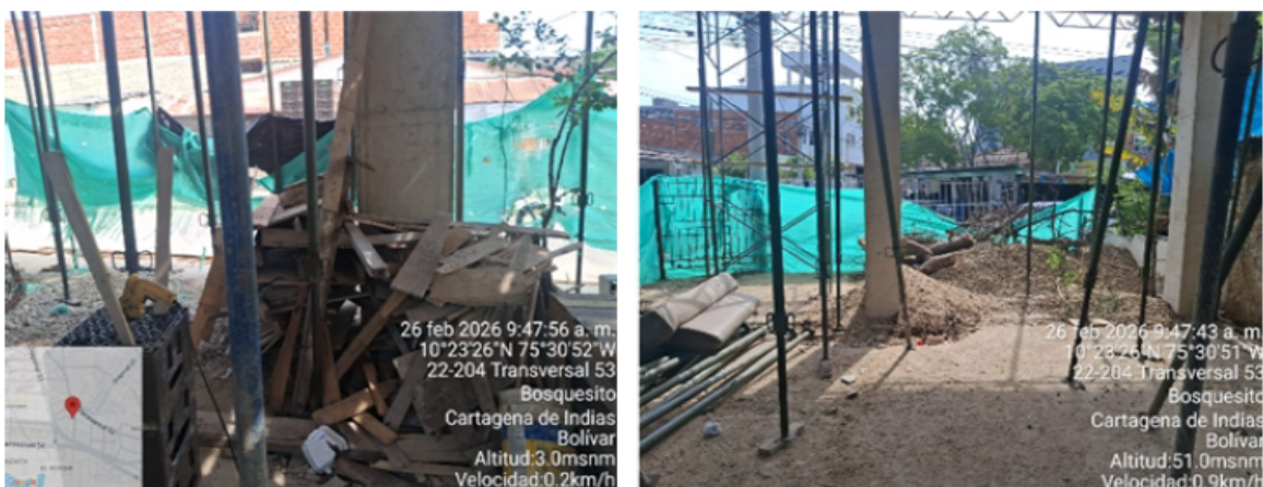
Ilustración 5: Residuos de Construcción y Demolición RCD.