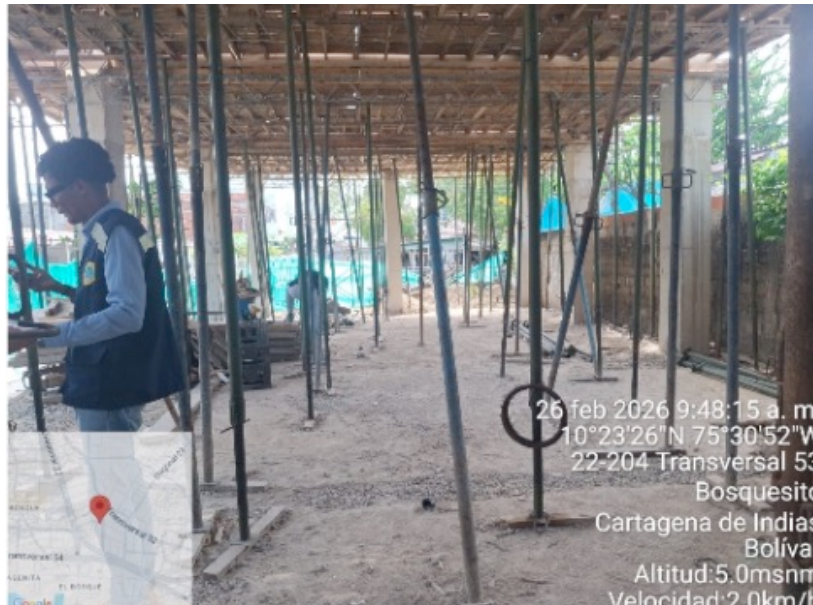
Ilustración4: actividades de armado de estructura para el segundo nivel.

Adicionalmente, se evidencio que el proyecto de Víctor Hugo Aguirre Villegas. Al momento de la visita Se encontraba desarrollando actividades de armado de estructura para el segundo nivel.