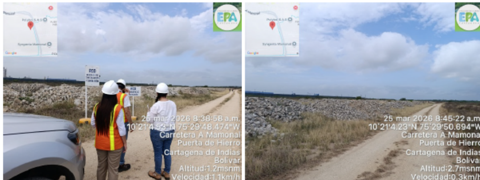
Figura 2. Acopio de RCD.

Actualmente, únicamente se están llevando a cabo labores de acopio de residuos de construcción y demolición (RCD), en particular residuos de excavación, sobrantes de adecuación del terreno y materiales pétreos, los cuales son susceptibles de ser aprovechados como material para la adecuación del predio.