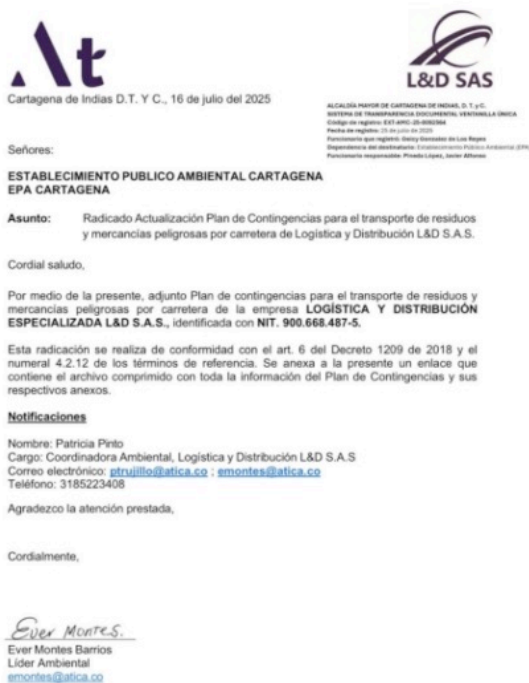
foto 9. Radicado Plan de Contingencia

Se adjunta el radicado de la actualización.