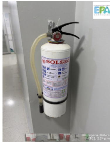
foto 7. Extintor