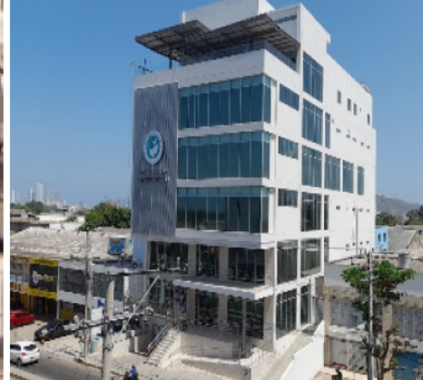
foto 1 y 2 Localización geográfica y Ubicación.