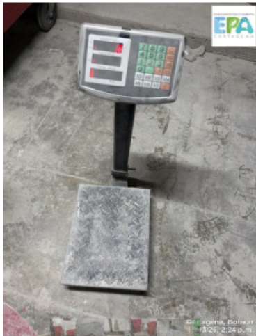
foto 6. Bascula