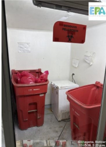
foto 4. cuarto de almacenamiento

La entidad cuenta con actas de certificado de residuos peligrosos por parte del gestor transporte y de disposición final, así como los manifiestos o recibidos de transporte, dando cumplimiento a lo establecido en el decreto 4741 de 2005 compilado en el artículo 2.2.6.1.3.7 del Decreto Único Reglamentario del sector ambiente y desarrollo sostenible 1076 de 2015.