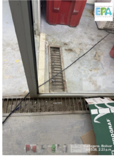
foto 5. Dique de contención