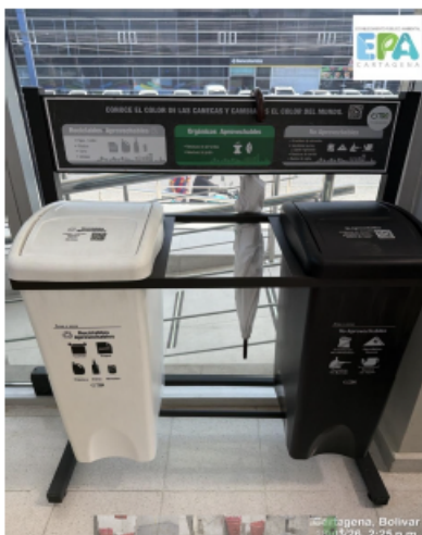
foto 8. Clasificación