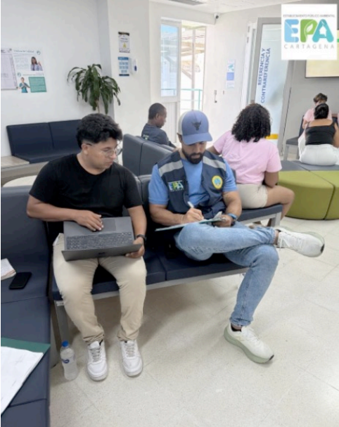
foto 3. Socialización gestión externa RESPEL