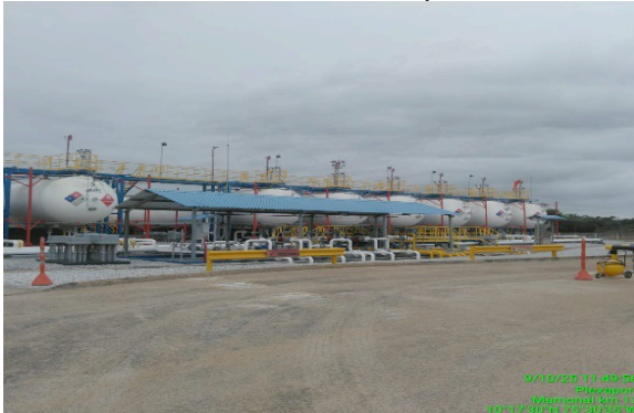
Figura 4. Tanques de almacenamiento GLP

manera: Área oficinas administrativas, Área operativa, 12 tanques horizontales para almacenamiento con capacidad de 90.000 galones c/u, 4 canopio con sus respectivas islas (4) para despachos de GLP, 1 estación de odorización, detectores de gas, detectores de llama, 1 estación de aire comprimido.