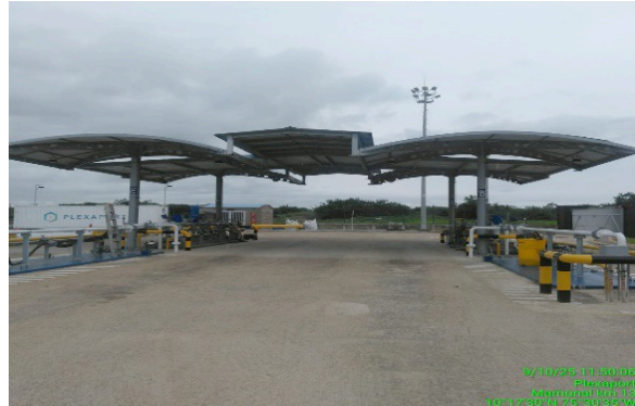
Figura 5. Canopio e islas

PLEXAPORT S.A.S., empezó su producción el año 2019, el GLPP procedente del Golfo de Mexico y la Refinería, llega a las instalaciones de la empresa Vopak, desde donde a través de tuberías subterráneas de 5,92 pulgadas como reza en la póliza de seguro de construcción del gaseoducto, es conducido a la empresa, igualmente este proceso se realiza con camiones Cisternas. El proceso de distribución se realiza mediante camiones cisterna y/o carrotanques. Para el desarrollo de sus operaciones la empresa cuenta con un total de 32 personas.