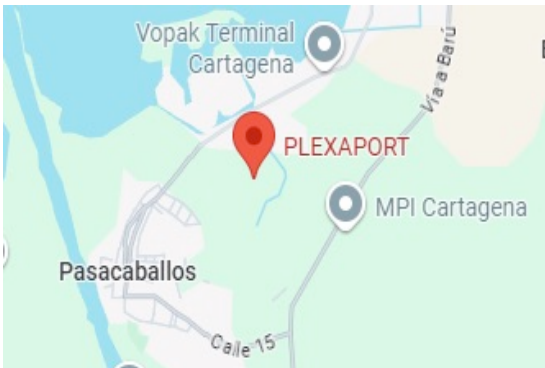
Figura 1. Ubicación Planta

El día 09 de octubre de 2025, se realizó la visita de control y seguimiento a las instalaciones de la empresa PLEXAPORT S.A.S., identificada con NIT 901.069.982- 3, código CIU 4661 “Comercio al por mayor de combustibles, aceites y lubricantes” y con actividad comercial recepción, almacenamiento, transformación (/mezclado de propano y butano en diferentes proporciones de acuerdo a las solicitudes), trasiego y despacho, ubicada en Mamonal Km 13 en la Zona Franca e Industrial de Cartagena, Isla 2 lotes 1, 2 y 3, con coordenadas geográficas 10°17'30.286" N – 75°30'34.84° W.