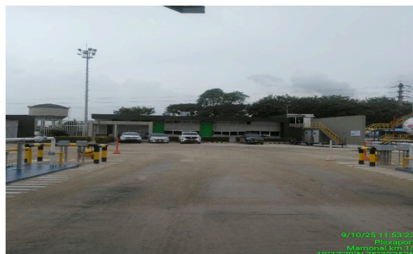
Figura 2. Fachada interna planta