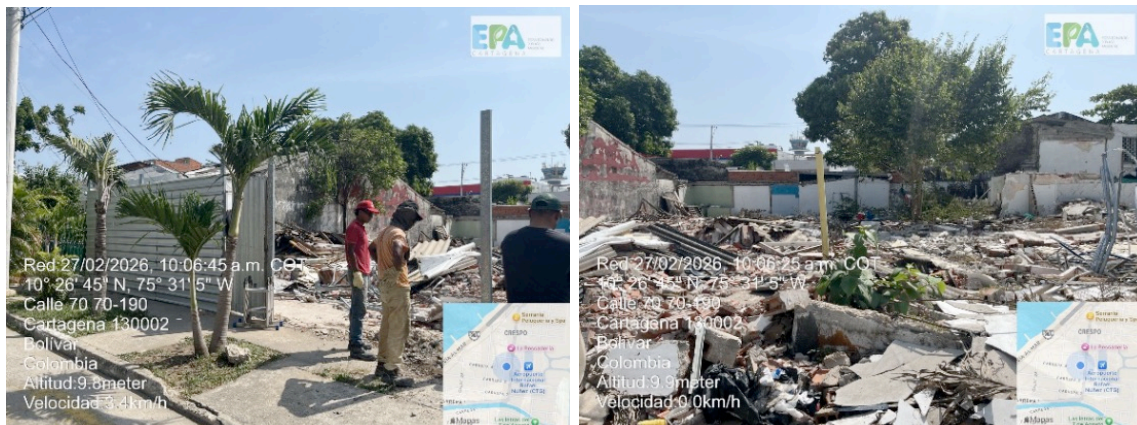
Figura 2. Actividades en ejecución.

Al momento de la visita se estaban ejecutando actividades de cerramiento del lote, lo que representa un avance de obra aproximado del 1 %. Cabe resaltar que las labores de construcción iniciaron el 18 de febrero de 2026, fecha en la cual se llevó a cabo la demolición de la infraestructura existente.