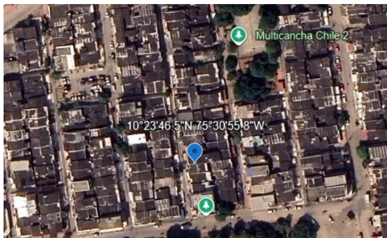
Imagen 1: Ubicación del Árbol, República de Chile, manzana 28, lote 9, Cartagena de Indias, Bolívar Georeferenciación: 10°23'46.518"N 75°30'55.746"W, Fuente: Google Earth

Esta situación se agrava considerando la actual temporada de fuertes vientos e intensas lluvias, lo que incrementa el riesgo para la integridad física de las personas y la posible afectación a la infraestructura de las viviendas aledañas.