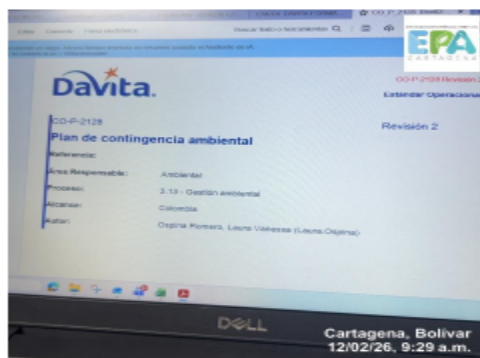
foto 14. Plan de Contingencia

DAVITA S.A.S. cuenta con el Plan de contingencia de acuerdo con lo establecido en el artículo 2.2.6.1.3.1. literal h del decreto 1076 de 2015. Para el año 2025 no presentaron soporte de simulacros con la ARL, cuenta con herramientas y directrices en cada caso para derrames, ruptura de bolsas o cualquier accidente que se presente en el movimiento interno de los residuos.