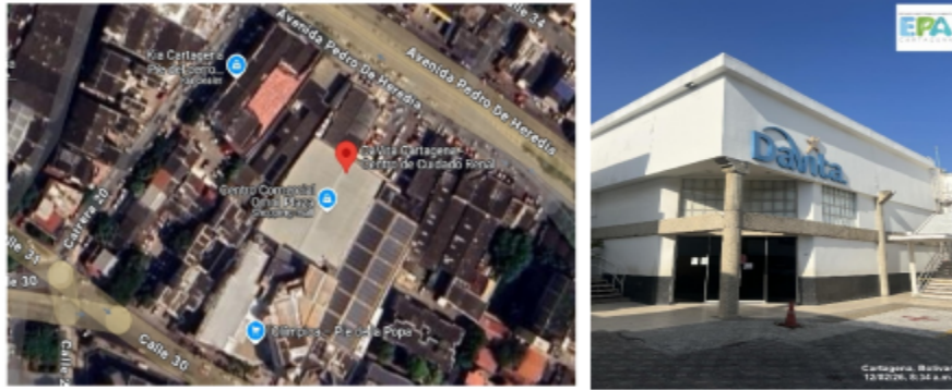
Foto 1 y 2. Vista satelital y localización DAVITA S.A.S.

DAVITA S.A.S. está localizada en la dirección calle 32 #20-104 omniplaza avenida Pedro de Heredia con coordenadas 10°25'16,562" N – 75°31'55,674" O