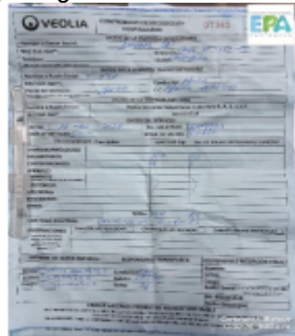
foto 11. Comprobante de Recolección

Durante la visita se verificaron certificados del segundo semestre de 2025 donde se evidencia una frecuencia de 5 a 6 veces por semana, cumpliendo con el numeral 4.2.2.3 de la Resolución 0591 de 2024 para generadores de su volumen