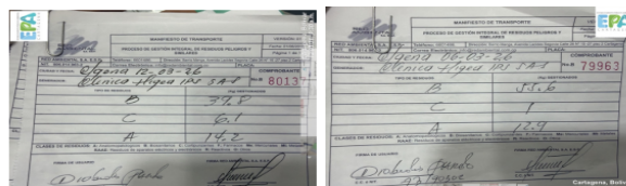
foto 11 y 12. Manifiesto de Recolección

Durante la visita se evidenciaron los comprobantes de recolección de RESPEL verificándose que los residuos de riesgos biológicos o infeccioso, son recolectados con una frecuencia de dos (2) veces por semana, dando cumplimiento a lo establecido en el numeral 4.2.2.3 de la Resolución 0591 de 2024.