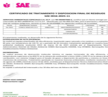
foto 14. Certificado de tratamiento

CLINICA HIGEA IPS S.A. presento los certificados que le suministro RED AMBIENTAL S.A. E.S.P. donde se evidencia el convenio con SAE y el tipo de tratamiento que se le da a los RESPSEL, especificando que los Biosanitarios se les hace un proceso de incineración, mientras que los cortopunzantes se les realiza la incineración.