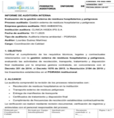
foto 13. Solicitud, Auditoria

De acuerdo con la documentación solicitada durante la visita, se evidenció mediante correo electrónico la solicitud para realizar Auditoria a la gestión del transportador RED AMBIENTAL S.A. E.S.P. el 19 de noviembre de 2025.